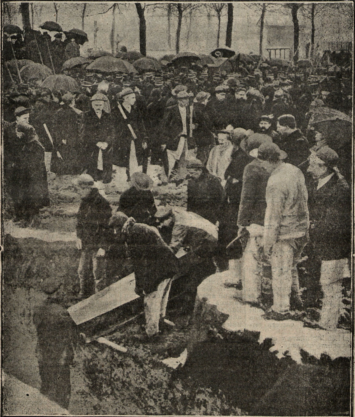
Enterramiento de las víctimas de la explosión.