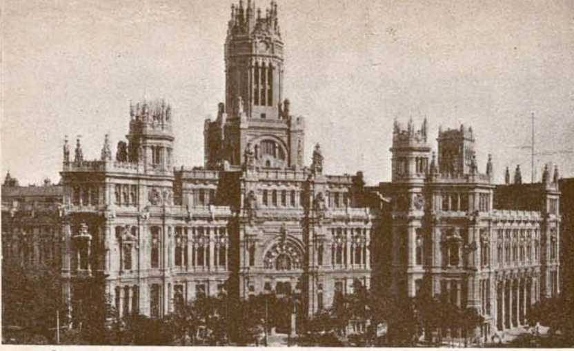
Palacio de Comunicaciones.