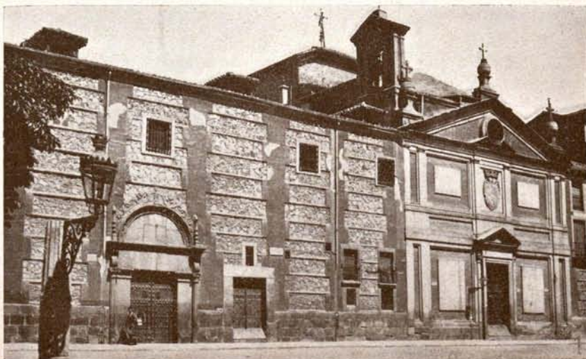
Iglesia de las Delcalzas.

Merecen atenta visita también el de Arte Moderno, el de la Academia de San Fernando, el Romántico, el del Instituto de Valencia de Don Juan, el de Artes Industriales, el Municipal, el Cerralbo, el de Reproducciones Artísticas, Artillería, Naval, Ciencias Naturales, Antropoló-