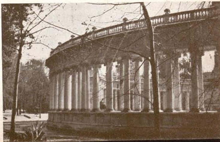
Columnata del monumento a Alfonso XII, en el Retiro.

La parte vieja de la ciudad se caracteriza, por la agrupación desigual y graciosa de los tejados de las casas, de los cimborrios de los templos, de las espadañas conventuales. Estampa de provincia española, corregida por el aspecto particular de su arquitectura religiosa (que corresponde sobre todo a los estilos barroco y neoclásico, en una modalidad especial