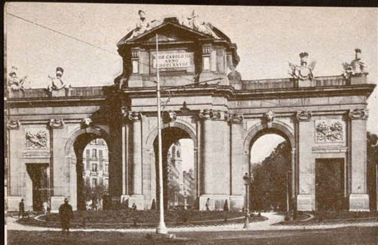
Puerta de Alcalá.

que puede llamarse estilo madrileño ) y agrandada por las perspectivas del "Campo del Moro" (jardín del antiguo palacio real) y de la llanura castellana que se inicia a las puertas de Madrid. La majestuosa masa del palacio, hermanada con la cúpula de San Francisco el Grande (que tiene un diámetro mayor que el de la de los Inválidos, de París, y la de San Pablo, de Londres) y con las frondas de la "Casa de Campo", compone un fino conjunto, de visión de Goya.