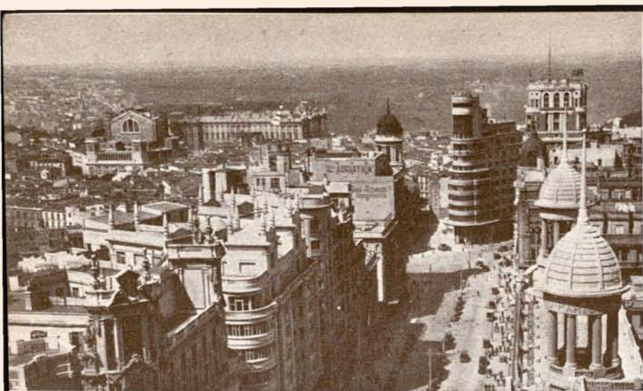
Vista parcial de Madrid desde la Telefónica.