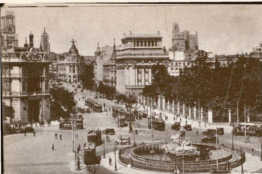
La Cibeles y calle de Alcalá, uno de los principales centros del tráfico.