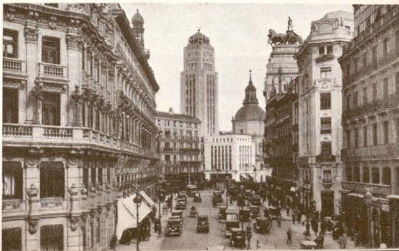
Calle de Sevilla.

La información referente a excursiones la hallará el lector en otro lugar de este folleto.