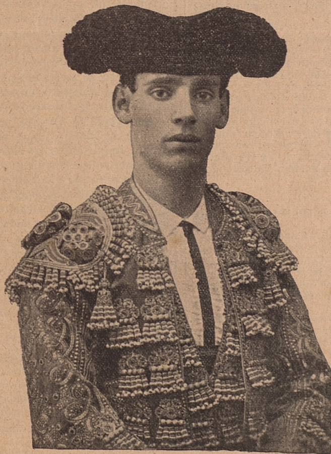
Ángel García Padilla