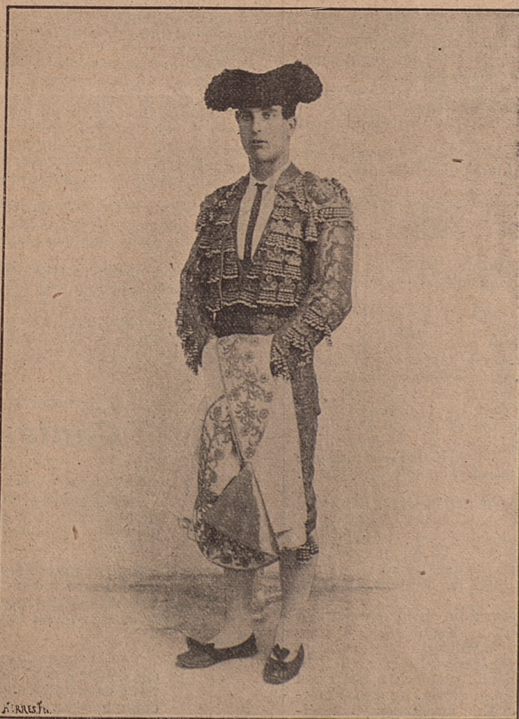
José García (Algabeño)