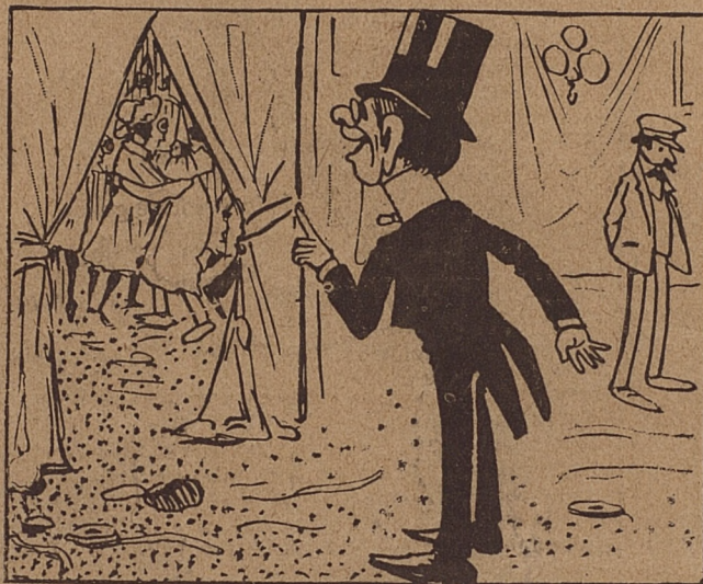
2. No lo dije; ya viene una mascarita hacia mí... y que debe ser de butén.