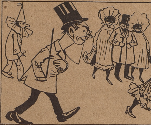
1. Me da el corazón que esta noche en el baile voy á sacar una buena conquista.