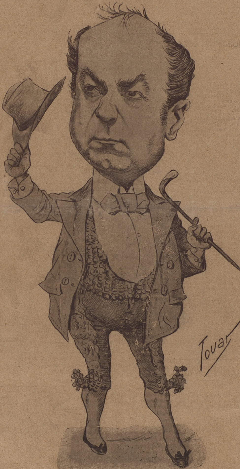
* Luis Mazzantini *