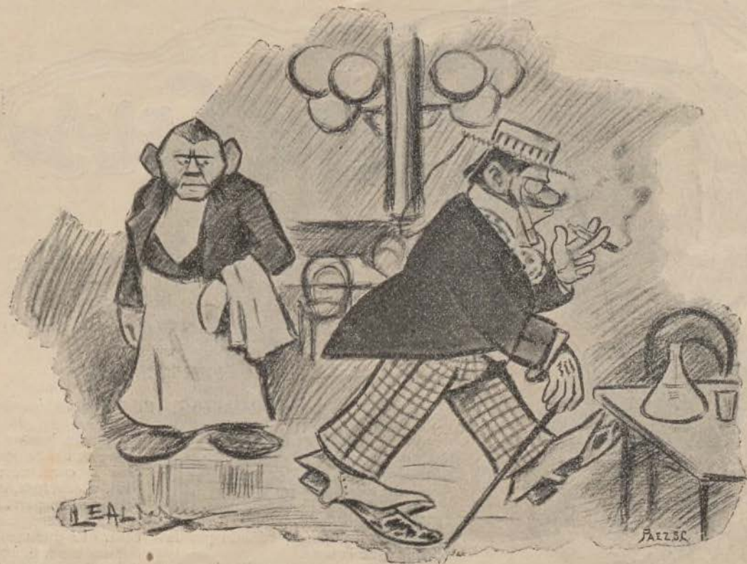
EL PARROQUIANO DEL VASO DE AGUA (Caricatura de Leal da Câmara.)