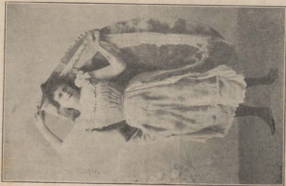
ESTRELLA DE PARIS