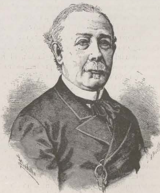
D. Ignacio José Escobar, primer marqués de Valdeiglesias.

Desde que tenía dieciocho años viene trabajando Escobar en el periodismo, cultivando todas las secciones, desde la crónica hasta la gacetilla. Cuando joven colaboró en El Imparcial y en La Ilustración y otros periódicos; luego consagró todo su esfuerzo al suyo propio, y por la significación