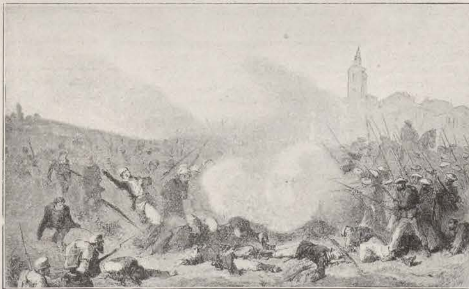
Momento difícil de la división Colomo, en Biurrun.

Era el plan del Comandante en Jefe del 1.º Cuerpo que, en tanto él con sus tropas avanzaba