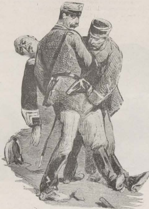
Trágico episodio de la lucha.

Pero rehechos, sin tardar, los carlistas y reforzado el 3.º de Navarra con el 2.º de la misma Región y el 2.º de Castilla, llevando a la cabeza al bravo Coronel Montoya, fué tal el empuje y rudeza del ataque, que las fuerzas liberales retrocedieron, dejando en poder del enemigo 70 prisioneros, habiendo habido