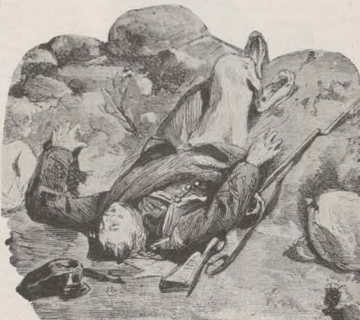
¡Por la Patria!

Ya en las riberas del Zidacos y cuando los carlistas, poderosamente reforzados, se disponían a atacar a Moriones, por ambos flancos, en las cercanías de Barasoain, recibieron, en su avance, durísima lección.