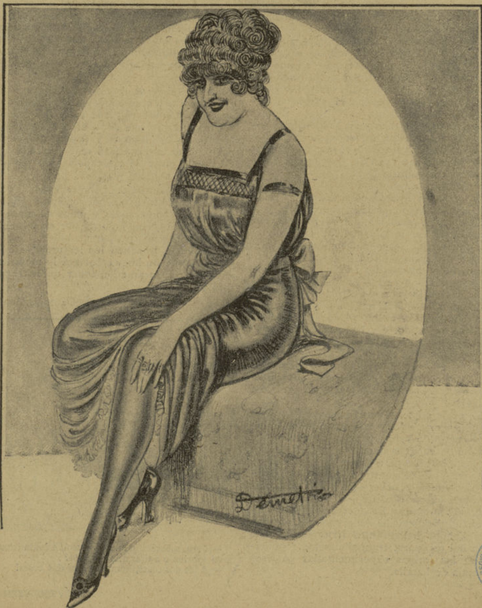
Esta es la hinchada. Biblioteca Regional de Madrid

REDACCIÓN Y ADMINISTRACIÓN: FACTOR, 4, ENTRESUELO :: APARTADO DE CO- RREOS 515 :: TELÉFONO 3951 :: 18 PÁGINAS, 5 CÉNTIMOS :: 25 EJEMPLARES, 75 CÉN- TIMOS :: SE PUBLICA LOS DOMINGOS :: AÑO I :: NÚM. 16 :: MADRID, 11 OCTUBRE 1914.