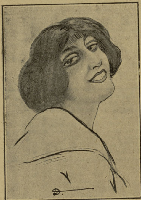
Una nena en el momento de decir: «¡No seas ganso, que me lastimas!»