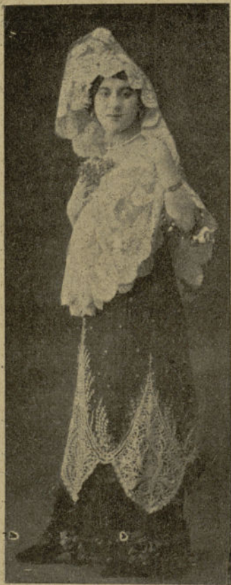
Canzonetista a transformación que está haciendo furor en «Chantecler», donde se la aplaude todas las noches.

bien siempre. Es muy útil, muy productivo—afirmó Pilarcita sonriendo.