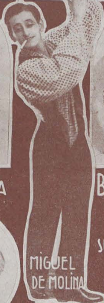
MIGUEL DE MOLINA