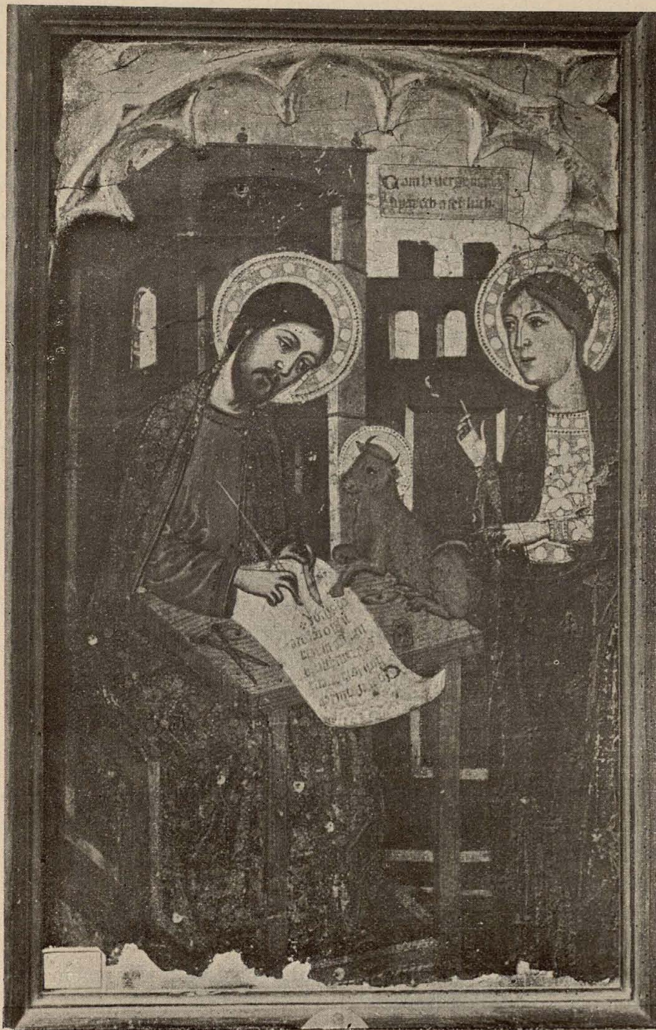
NÚM. 2.—La Virgen se aparece à San Lucas.

Tablas procedentes del antiguo retablo de los pintores de Valencia.