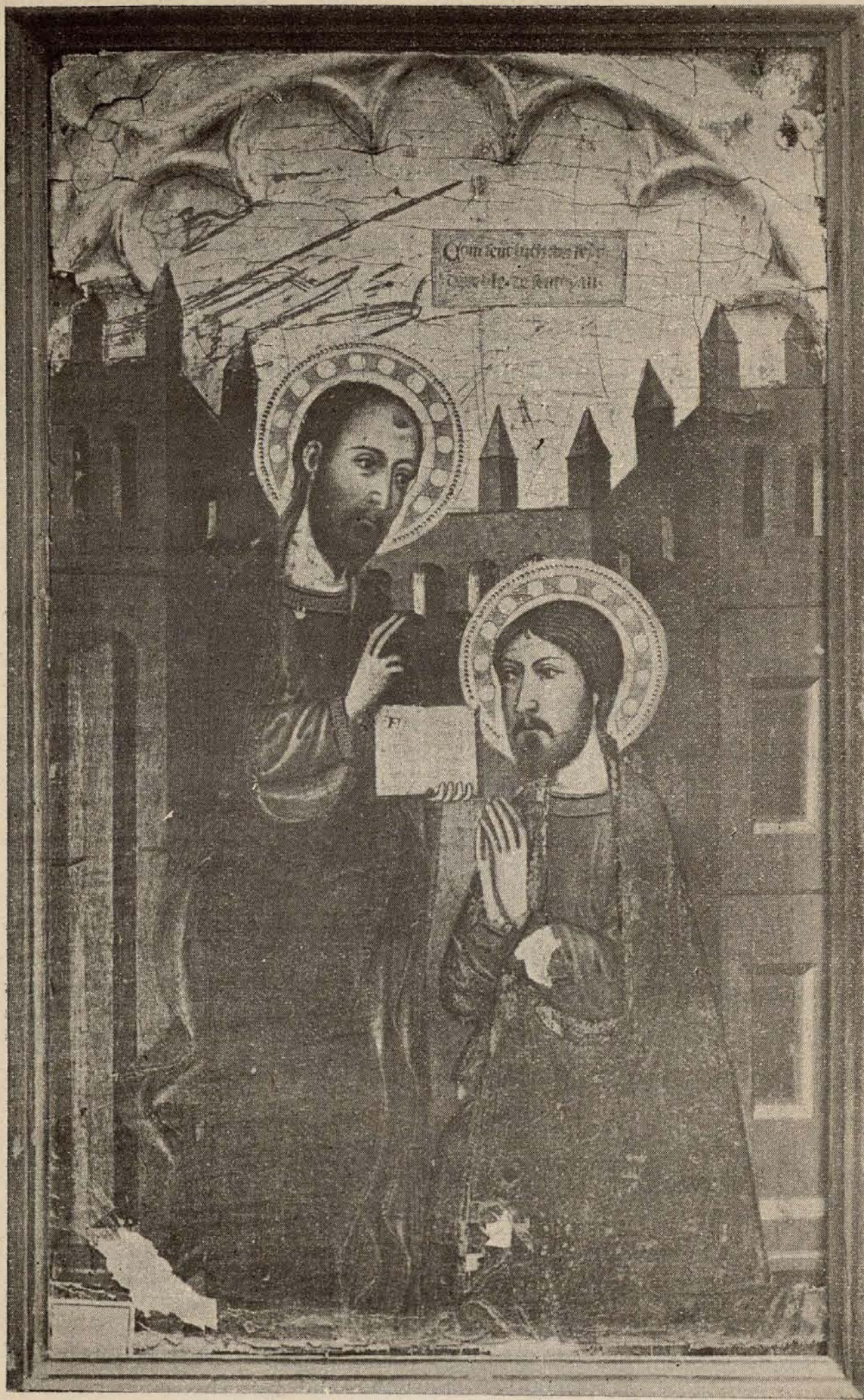
NÚM. 1.—San o Lucas es recibido como discípulo por San Pablo.

Tablas procedentes del antiguo retablo de los pintores de Valencia.