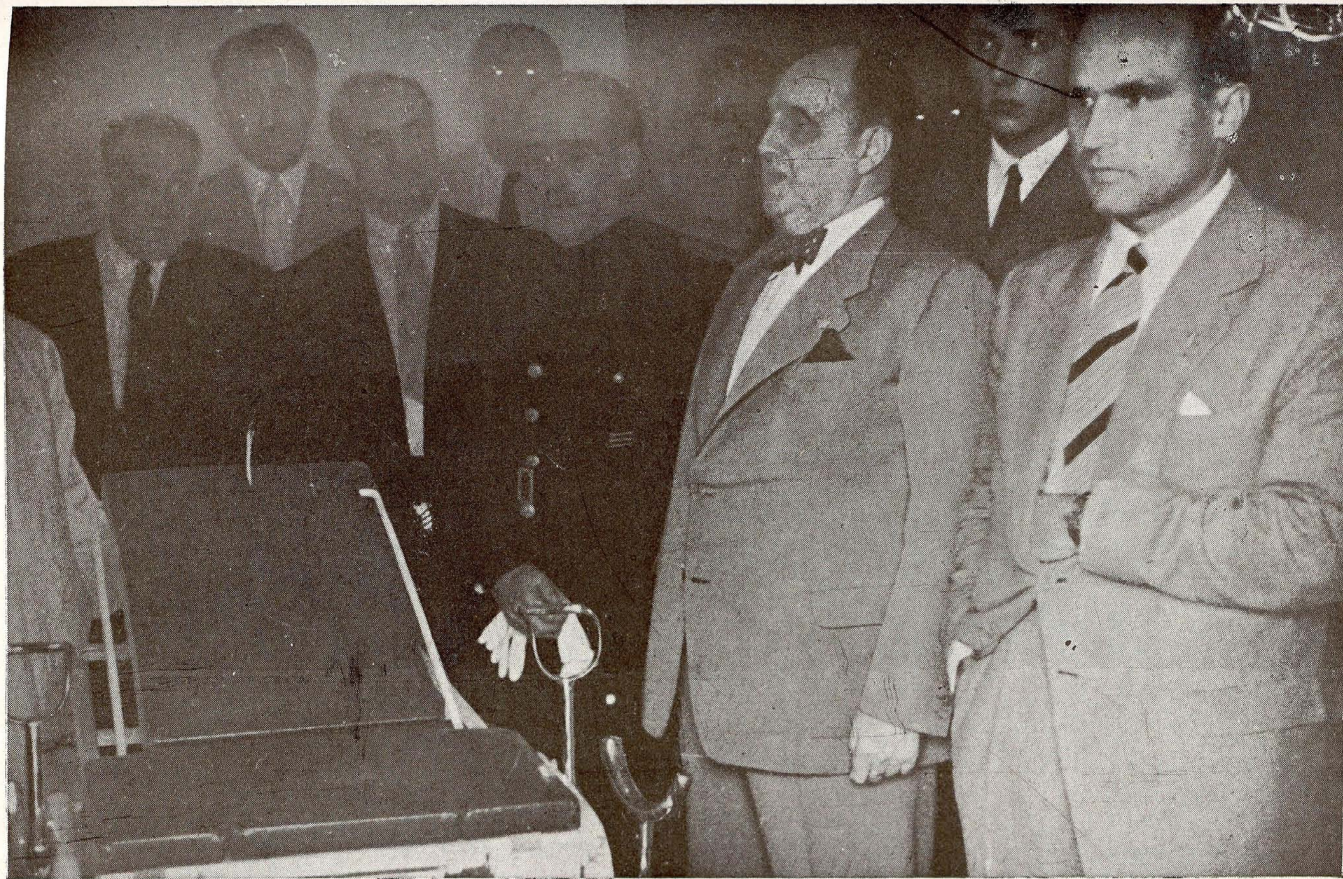
Santa María de la Alameda.—Acto de inauguración de la Clínica Sanitaria instalada por la Excm. Diputación Provincial, en colaboración con la Jefatura Provincial de Sanidad de F. E. T. y de las J. O. N. S.