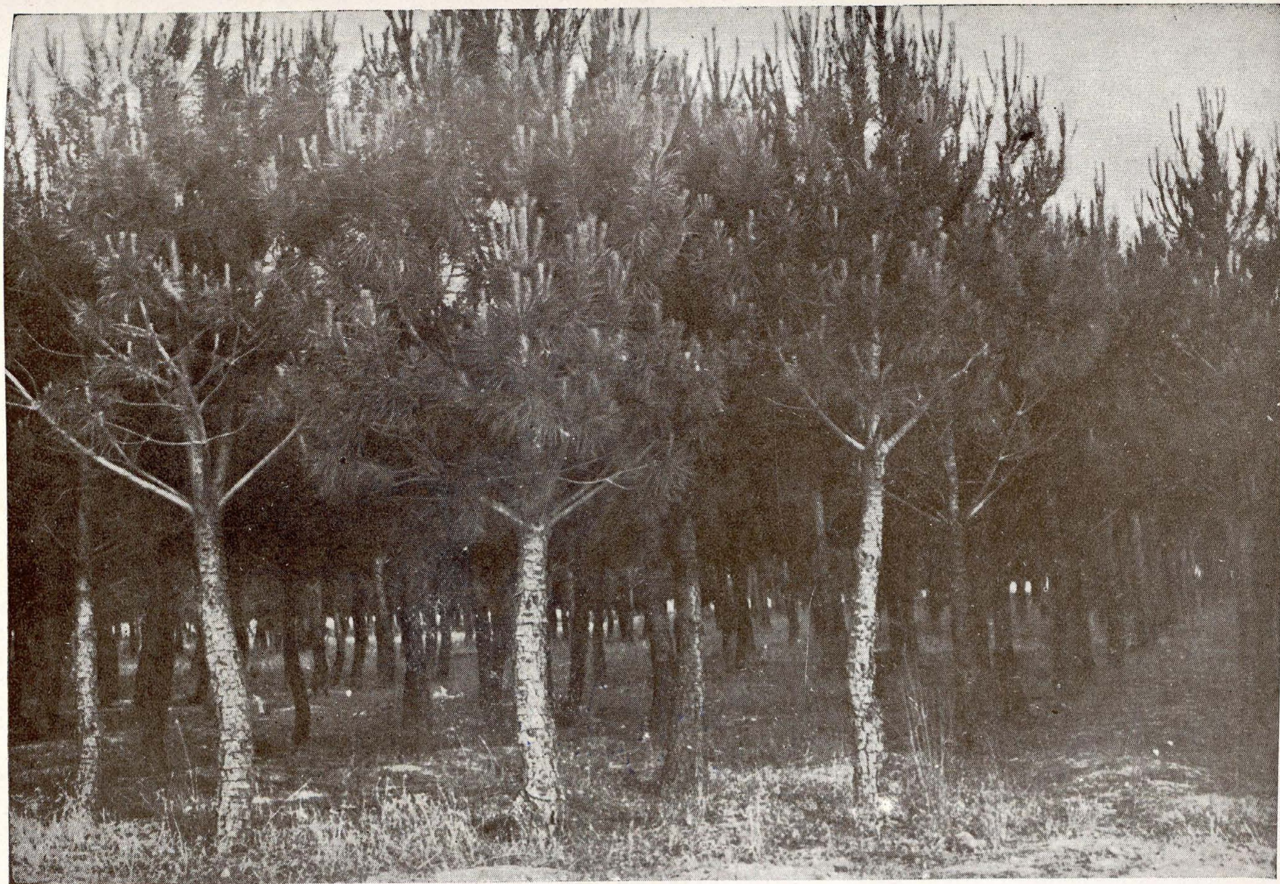
Servicio Forestal.—Repoblación con pino piñonero, en Las Rozas.