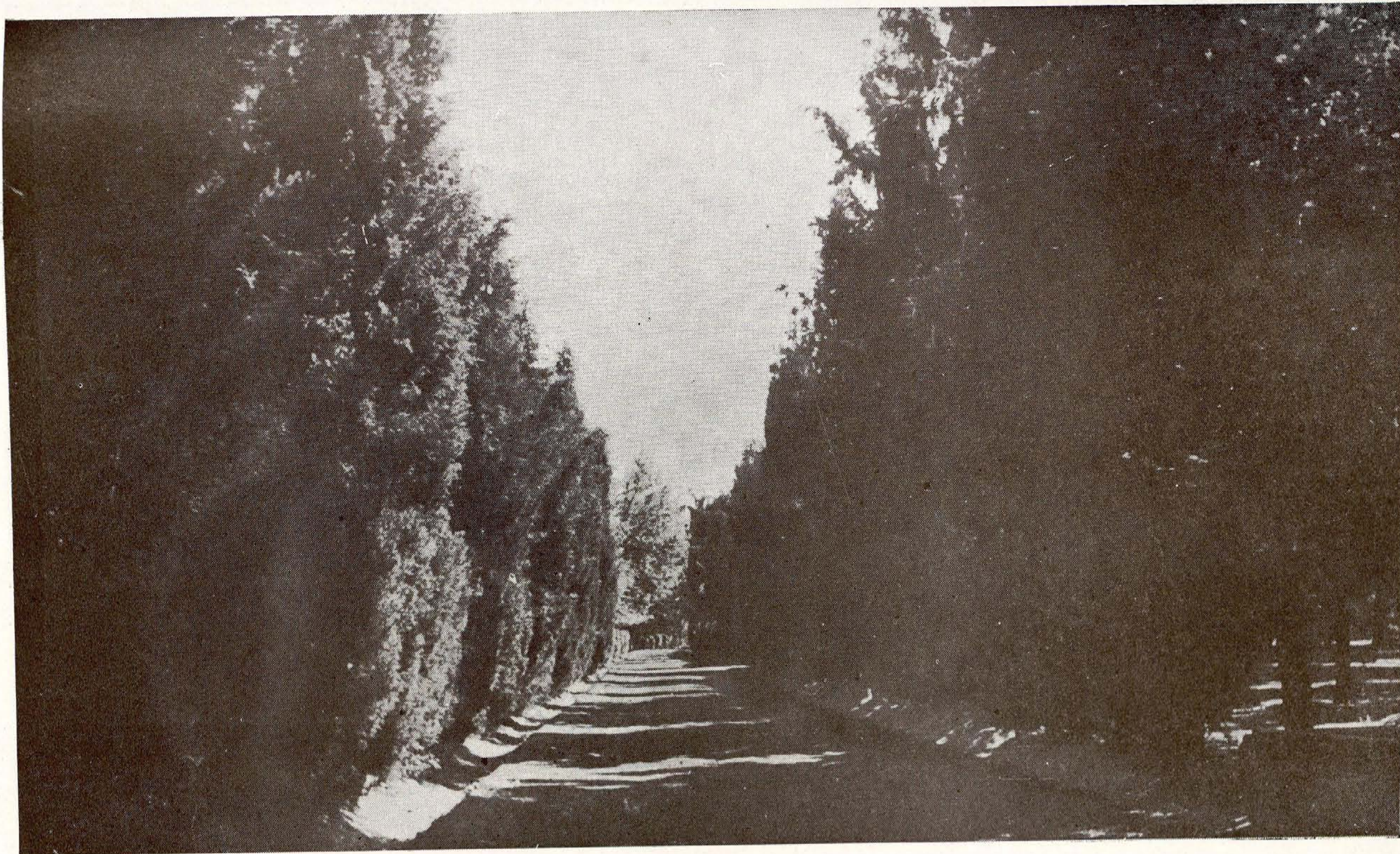
Servicio Forestal.—Vista parcial de los Viveros de Arganda del Rey. Paseo de cipreses.