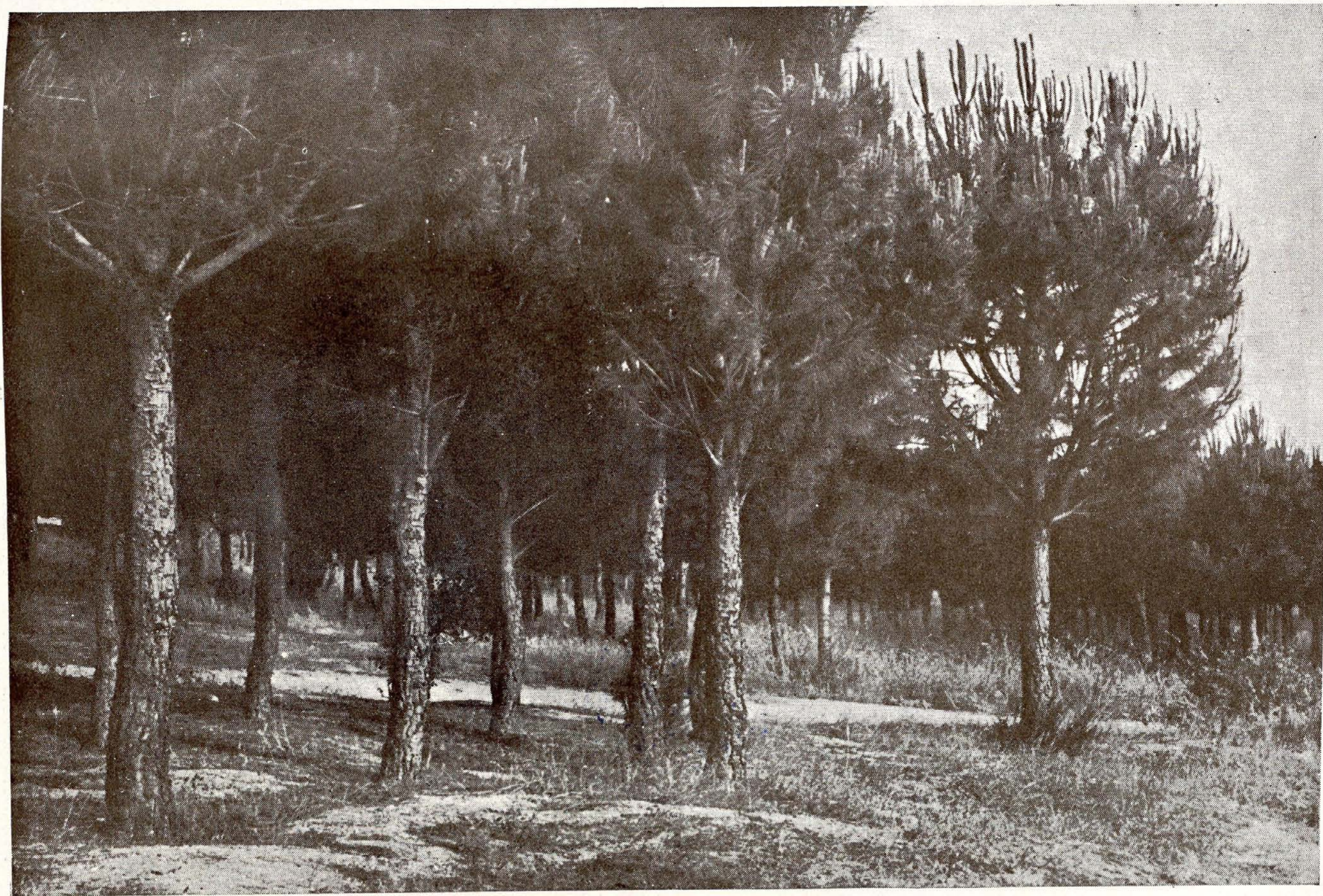
Servicio Forestal.—Replacación con pino piñonero, en Las Rozas.