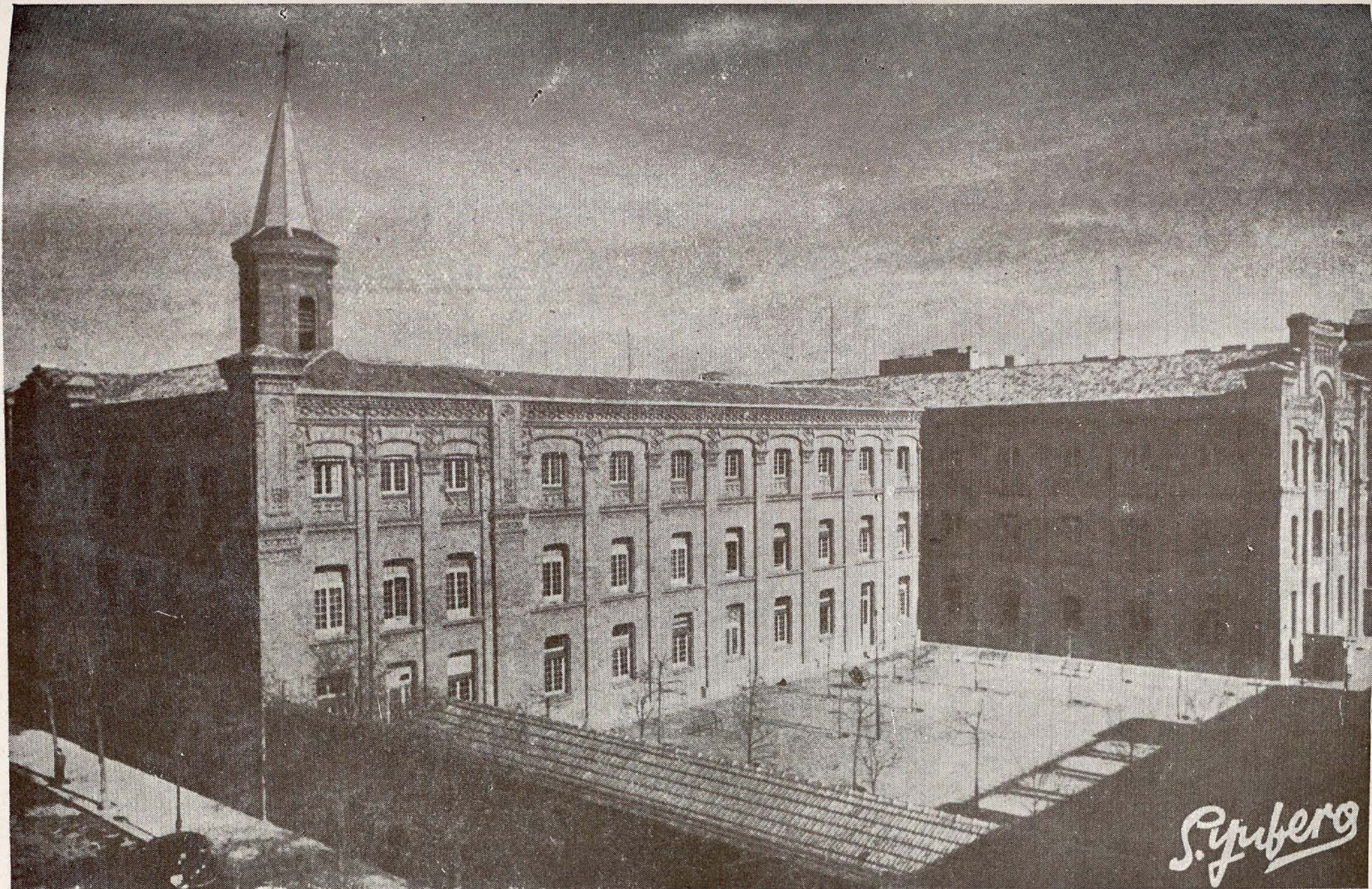
Colegio de Nuestra Señora de las Mercedes.