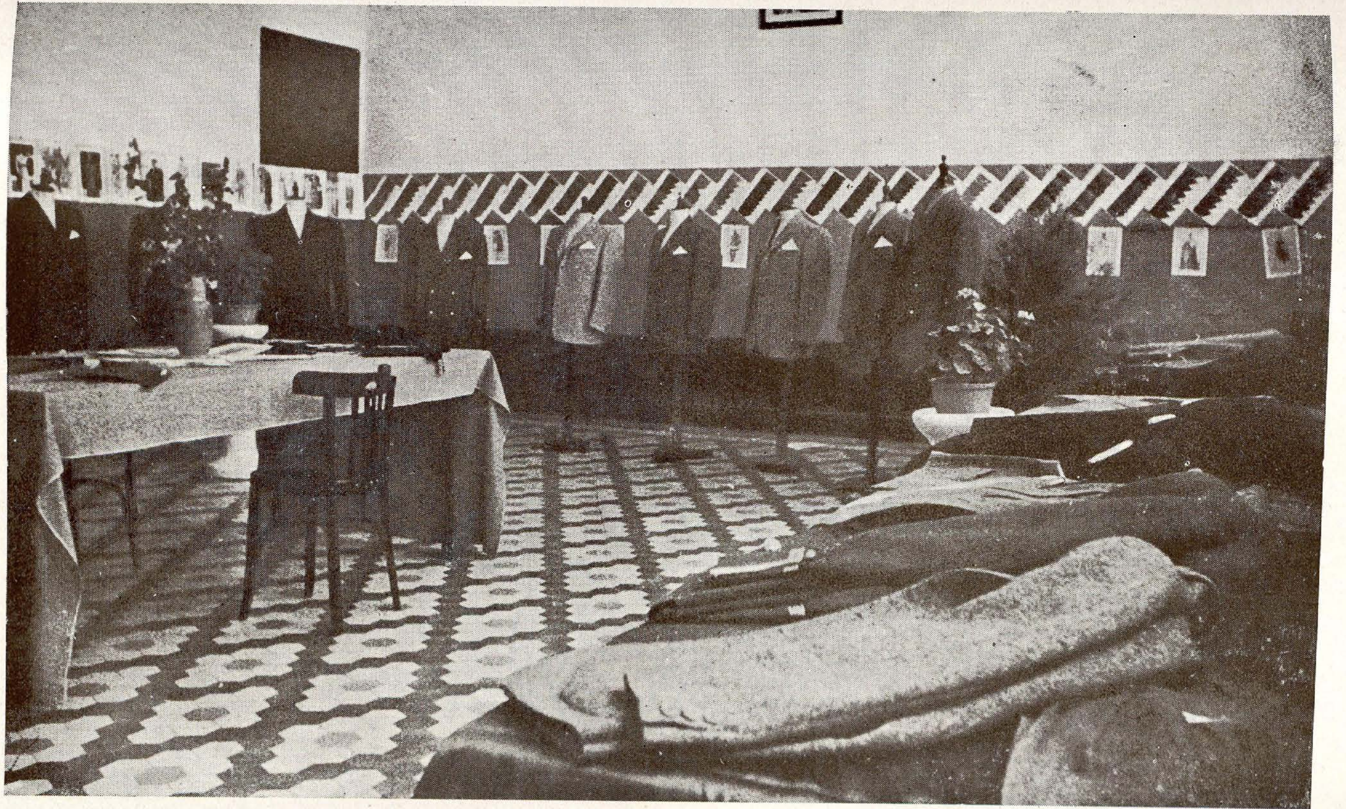
Colegio de San Fernando.—Exposición de trabajos de fin de curso en el taller de Sastrería.