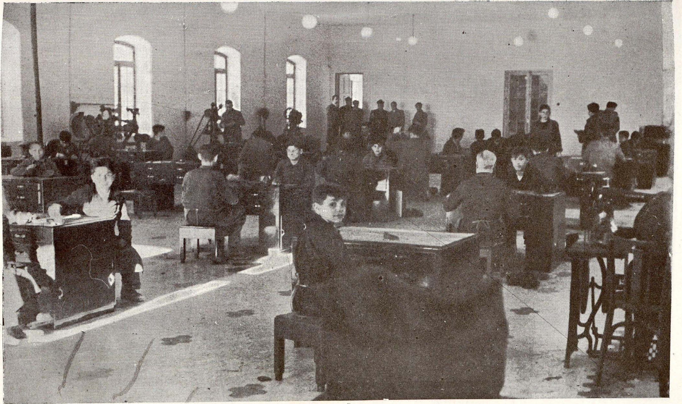
Colegio de San Fernando.—Taller de Zapatería.