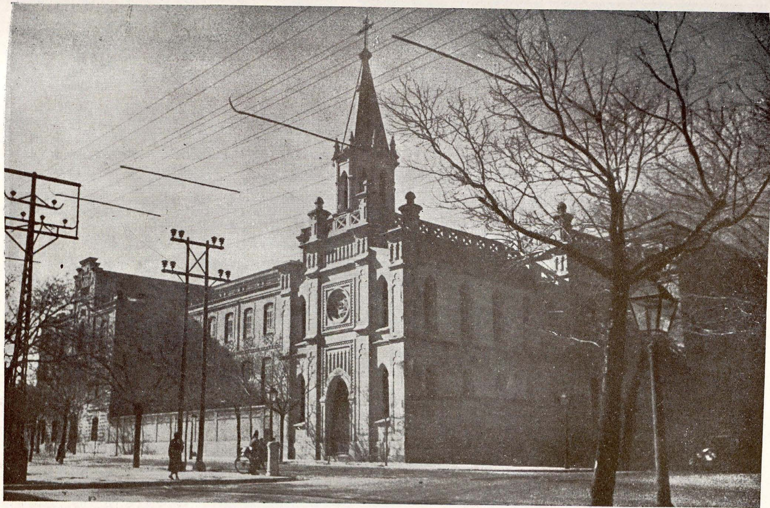
Inclusa y Colegio de la Paz.