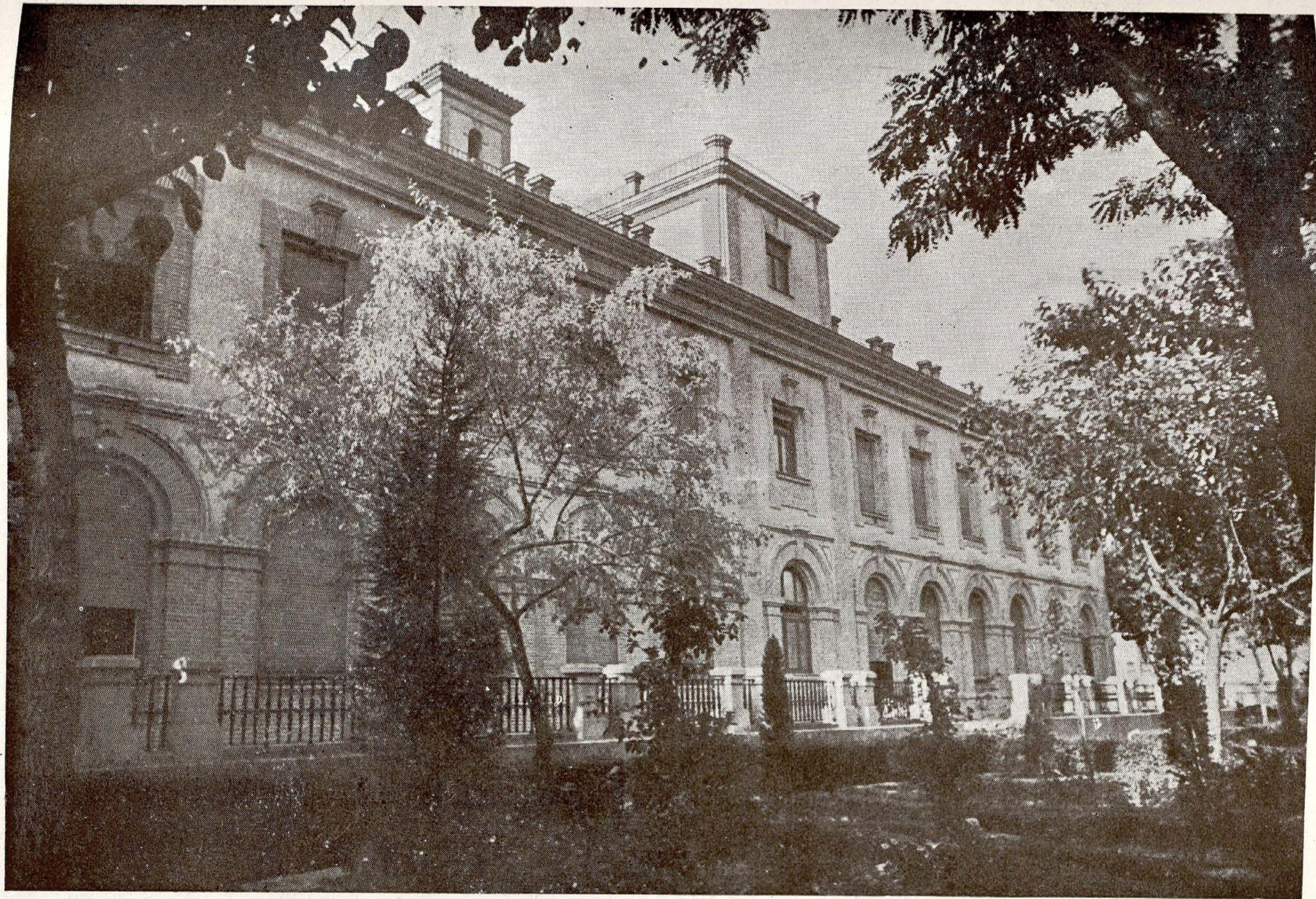
Instituto Provincial de Puericultura.—Fachada principal del Pabellón Zorrilla.