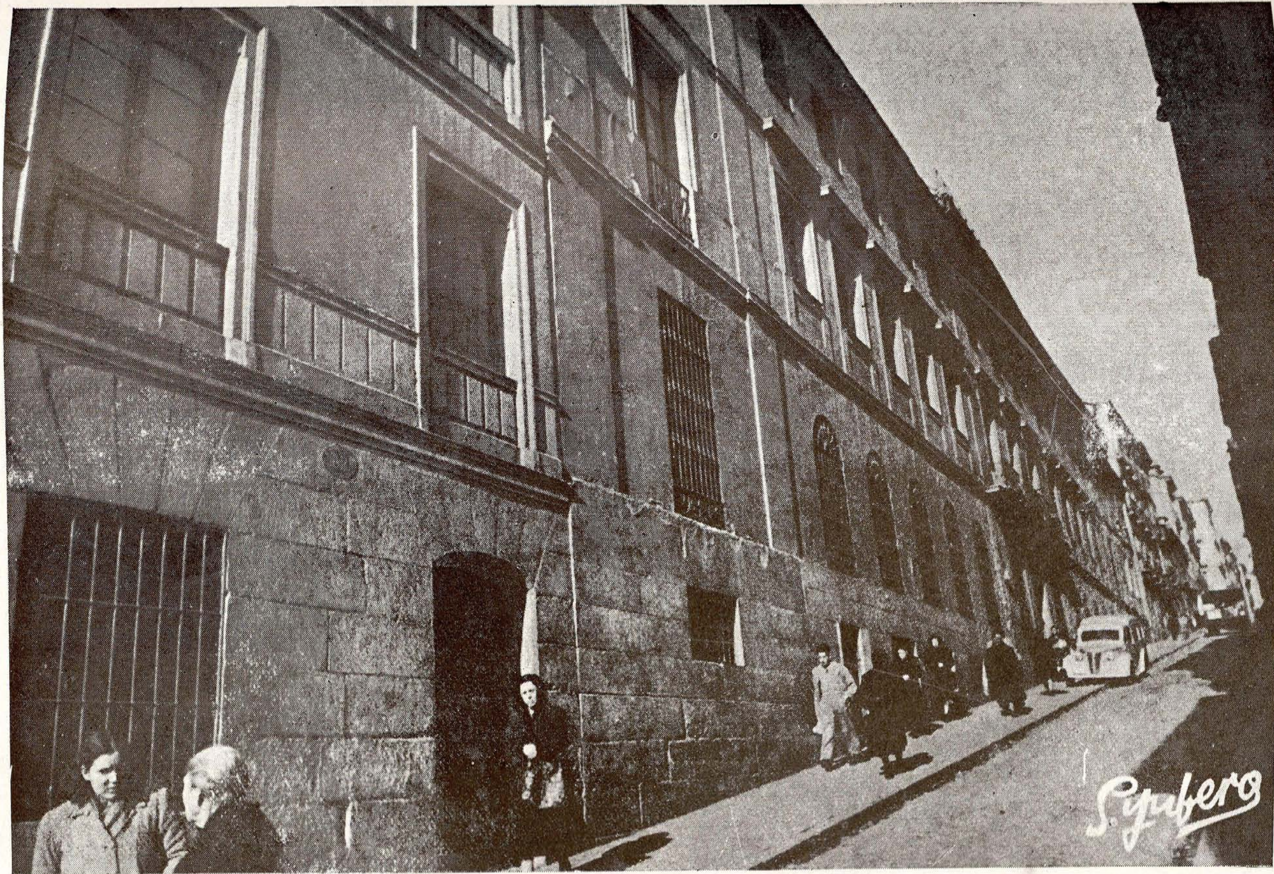
Actual Casa Provincial de Maternidad (Mesón de Paredes).