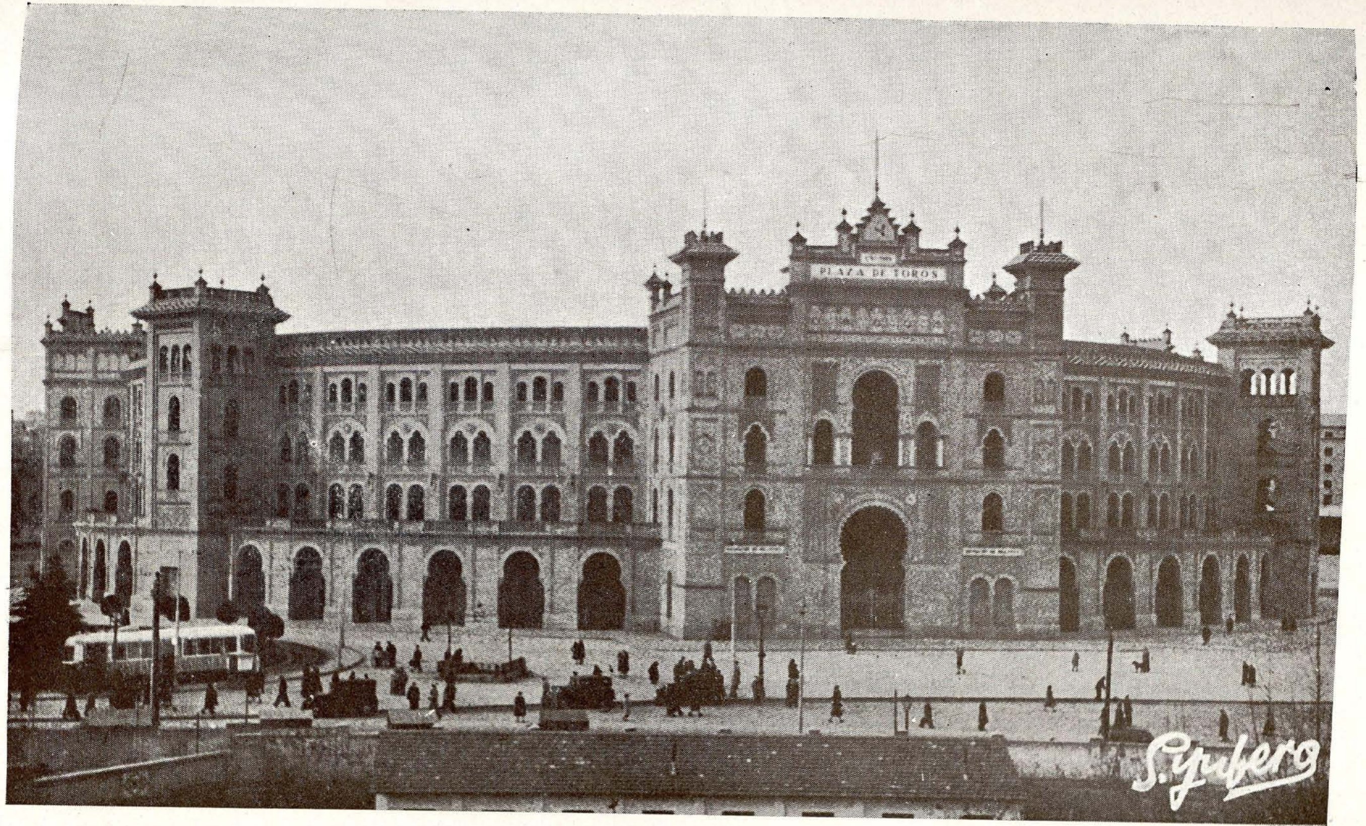
Plaza de Toros de Madrid.