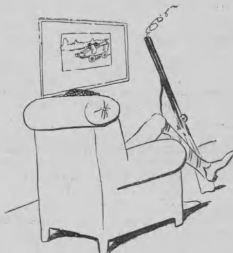
Y un ilustre sportman se quedará ocho días seguidos en su casa.