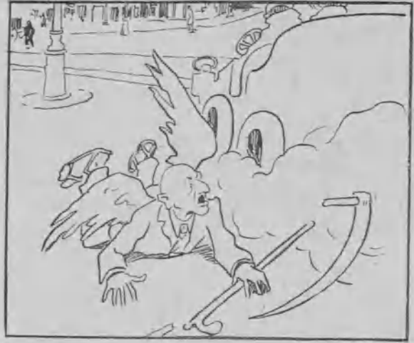
4. El Tiempo, al salir a la calle, sufre el inevitable atropello de automóvil; atropello que le favorece, pues le dota de un soberbio bastón último grito .