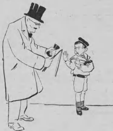
Habrà un niño tan raro que no querrá jugar al «diabolo».