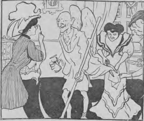
3. El Tiempo asiste a uno de esos tés de moda en los que todo el mundo habla del Tiempo. ¡Menudo traje es el que allí le cortan!... Y sigue cambiando.