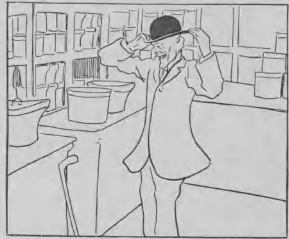
8. El Tiempo, que se va transformando, recuerda que lleva la cabeza al aire y decide cubrirse. El Tiempo se encapota, ó mejor dicho, se ensombrera .