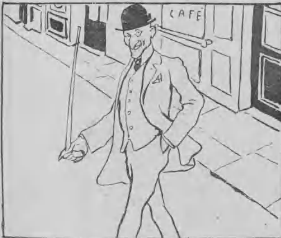
11. Y en efecto, el Tiempo sale calzado y convertido en un elegante sujeto.... ¡Qué ocasión para acudir al Congreso!.... El Tiempo se dirige a la carrera.... de San Jerónimo.