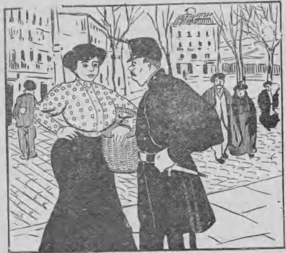
La «melicia» y la lotería.

—Pues yo que vosotros, haría una cosa para que me saliese más barato.... Devolver el casco.