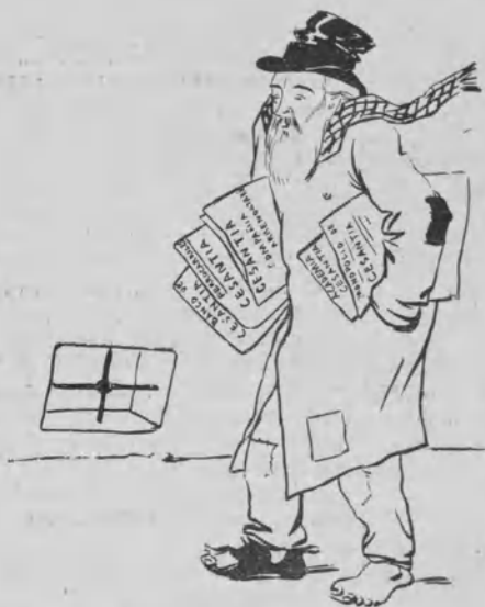
Pidal quedará treinta y seis veces cesante.