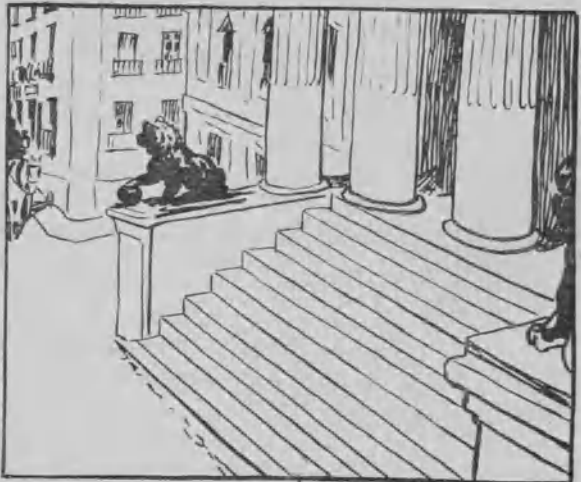
12. Y.... aquí tenemos que suspender esta historietita. Como el Tiempo se pierde siempre en aquella casa.... se nos ha perdido el protagonista. El año que viene continuaremos.