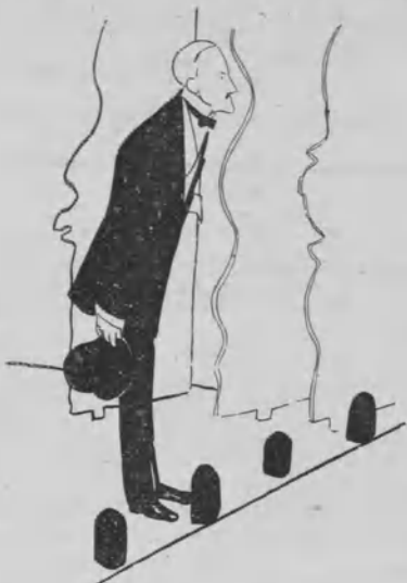
Se estrenará una comedia de un Quintero solo.