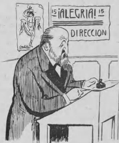
Vadillo se encargará de la dirección de ¡Alegría!