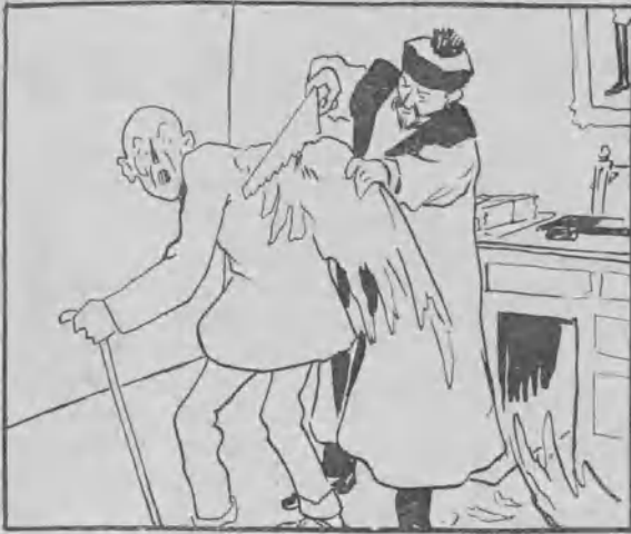
7. ¿A desplumar?... ¿Qué más quiero yo?... Exclama el Tiempo que pierde en el juzgado las alas y... ¡así van desde entonces, de despacio, los asuntos!...