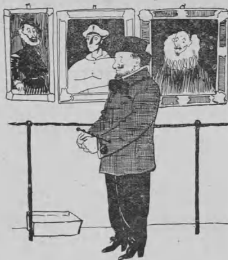
No se cambiará de lugar ni un cuadro del Museo.