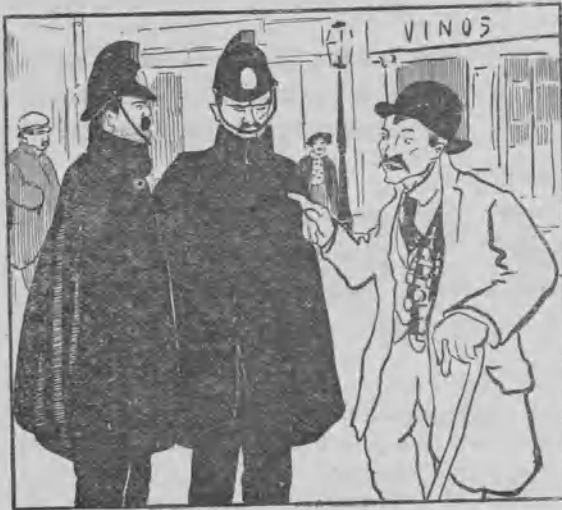
«Garibaldi» ante las reformas.

—¿De modo que ese nuevo equipo os le van descontando del sueldo?