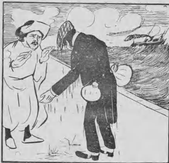
Nuestro Embajador en Rabat.

— Que tienen dentro una lombriz solidaria que va á acabar con ellos.