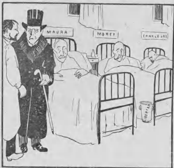
Después de un debate.

— Por dos razones me encuentro aquí, casta Febea. Porque he salido del Mundo y porque he creído evitar con mi palabra el negocio hispano-africano. Lo cual es estar en la luna.