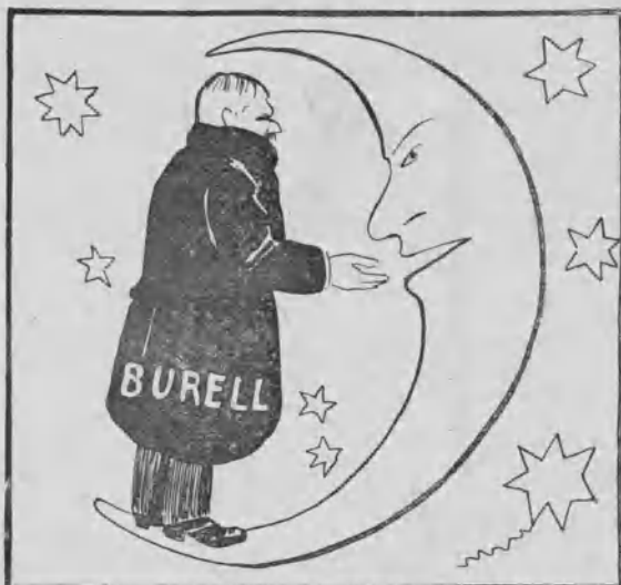
D. Julio en el cielo.

— Es terrible este Benavente. Hasta con los ojos de los muertos consigue aumentar la fama que siempre tuvo.