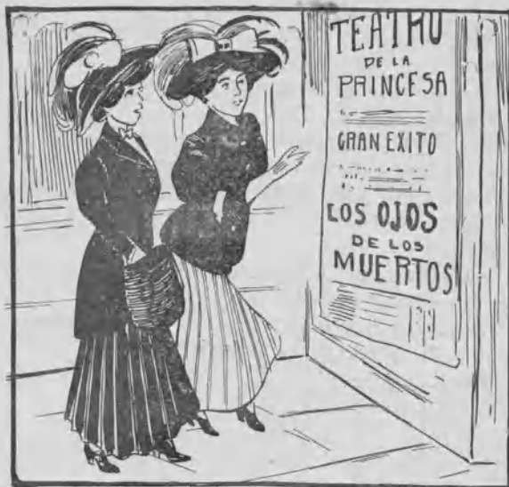
El último éxito.

— Es terrible este Benavente. Hasta con los ojos de los muertos consigue aumentar la fama que siempre tuvo.