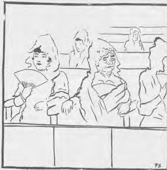
La Fiesta del sainete

Por fin hemos visto una función como Dios manda. Los actores, teniendo que pedir perdón por sus muchas faltas, y el público, en mantillas.