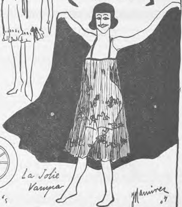
La Jolie Vampa