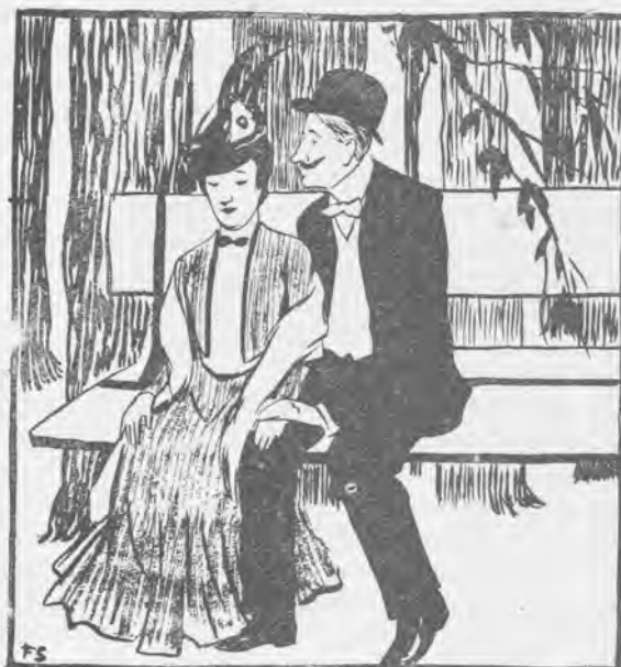
La juventud del año

¡Las patadas que hay que dar, señores, hasta ganar una copa de plata que no sirve ni para levantarla en honor de Garibaldi!