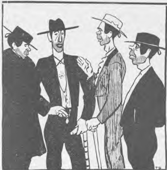
Comentarios a la cogida del Bomba

— Es lo que he dicho yo siempre, cabayeros: para torear vacas hay que tener mucho ojo.