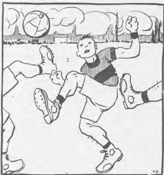
El campeonato del „Foot-ball“.

Por fin hemos visto una función como Dios manda. Los actores, teniendo que pedir perdón por sus muchas faltas, y el público, en mantillas.