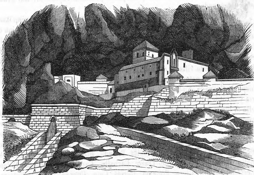
Vista de Cobadonga.

bre que es de ascenso , y comprende las 79 parroquias siguientes: Acellana, Agüeras, Agumo, Alavate, Biescas, Bigaña (Santa María), Bigaña (San Pedro), Bodenaya, Camuño, Carrea, Castañedo, Cermeño, Clavillas, Cordovero, Corés, Cornellana, Coto de Buenamadre, Cuevas, Endriga, Espina, Foceya, Folgueras, Godán, Guá, Labio, Leiguarda, Linares, Lodon, Llamoso, Mallecina, Malleza, Miranda, Montobó, Morteras, Obañes, Ondés, Páramo, Piero, Pigüeces, Piqueña, Plaza, Pola de Somiedo, Puerto, Quintana, Restiello, Riello, Riera, Salas, Santianes de Salcedo, Santianes de Taberga, Sorribas, Soto de los Infantes, Tameza, Taja, Teverga, Tolines, Torce, Urria, Valbona, Valle de Ajo, Veigas, Villamár (San Felix), Villamár (San Julian), Villamarin, Villamayor, Villandás, Villanueva, Villar de Vildes, Villas, Vi-