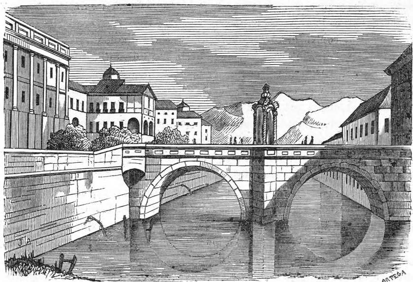
Vista de Murcia.

MURCIA: Ciudad situada en terreno llano, bañada por el rio Segura, sobre el que tiene un regular puente, á 57 leguas de Madrid. Su fundacion se pierde en la obscuridad de los tiempos, y conserva muchas inscripciones y antigüedades romanas. En 714 la ganaron los árabes por capitulacion despues de una heroica defensa, y pusieron por alcaide de ella al capitán Abrahen Azcandari, que se tituló primer rey de Murcia. En 1243 el santo rey Don Fernando envió á conquistarla á su hijo el infante Don Alonso, pero el rey que entonces la gobernaba Abenhudi-el-Alboagues, la entregó espontáneamente, y habiendo caído otra vez en poder de los árabes, fué restaurada por el rey Don Jaime V de Aragon en 1265, saliendo de ella 30,000 moros. Por los años de 1465 se