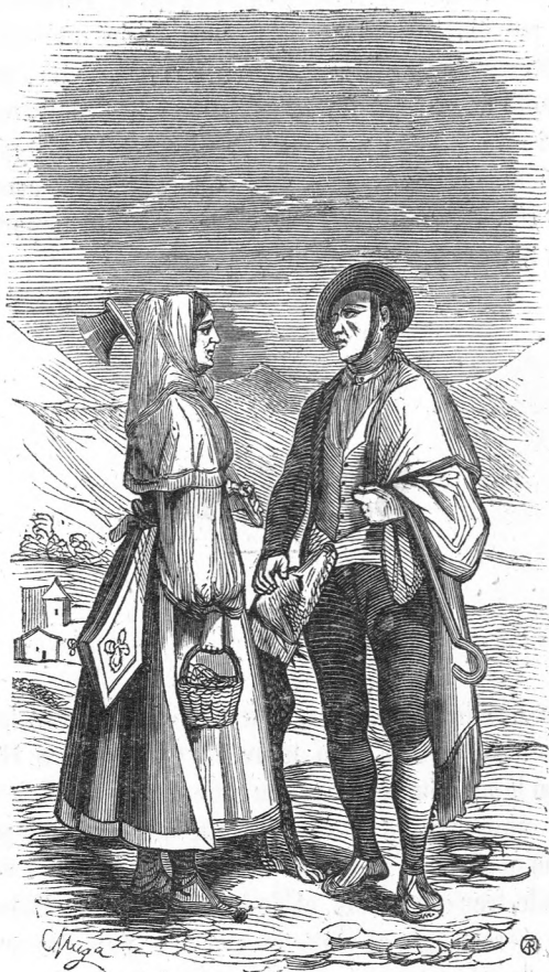
Montañeses de Leon.

VILLAMAÑAN: Villa situada á cinco leguas de Leon, en terreno llano á corta distancia del rio Esla. Es de antigua fundacion. Pertenece á la diócesis de Leon y al partido judicial de Valencia de Don Juan, de que dista tres y media leguas. Tiene 436 vecinos y 4,890 habitantes, una parroquia, un estanco, un pósito y hubo un convento de frailes. En la quinta de 1844 entraron en suerte 88 jóvenes de 18 á 24 años. Pagó por toda contribucion 62,426 rs., y cose-