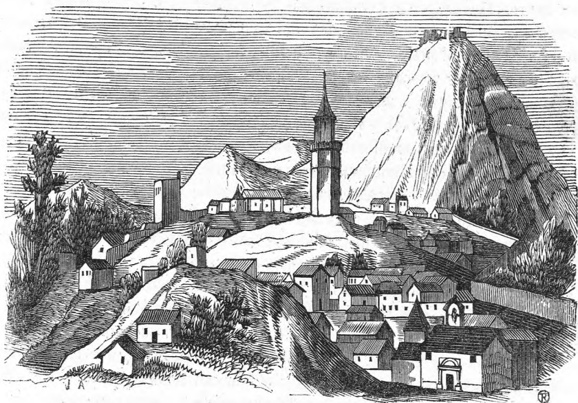
Peña de Martos.

ventajosa para defender las fronteras del reino de Granada, á que perteneció por espacio de mas de 500 años, hasta que fué conquistada por el Santo rey don Fernando, quién la cedió á los caballeros de Calatrava. Consta de 3,044 vecinos y 11,072 habitantes. Corresponde á la diócesis de Jaen y partido judicial de su nombre que es de ascenso , y comprende los 10 pueblos de Escañuela, Fuensanta, Higuera de Martos, Jamilena, Martos, Porcuna, Santiago de Calatrava, Torredonjimeno, Valdepeñas y Villardonpedro. Hay administraciones de loterías y rentas, tres parroquias, dos conventos de monjas, un hospital, un posíto y hubo dos conventos de frailes. En la quinta de 1844 entraron