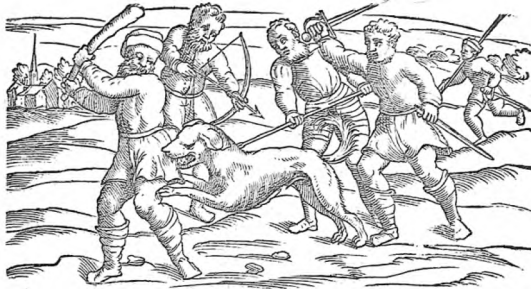
Σημεία τῆς λύσσας, καὶ τὸν ὄψιν αὐτοῦ δεδουμέναν. SIGNA RABIOSI CANIS, ET DE MORSORVM ABEO. CAP. XXXVI.