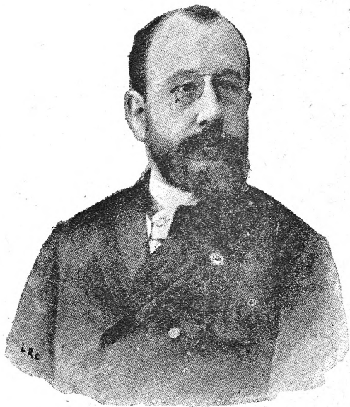
EXCMO. SR. D. TOMÁS CASTELLANO Y VILLARROYA.

Es también una de las personalidades más notables del partido conservador, cuya jefatura tiene en Zaragoza, en donde ha ejercido cargos públicos á raíz de la Restauración, y sobre todo, y antes que nada, es un verdadero prestigio por sus excelentes condiciones de seriedad, honradez y trabajo, causantes de su popularidad y del respeto general de que se ve rodeado.