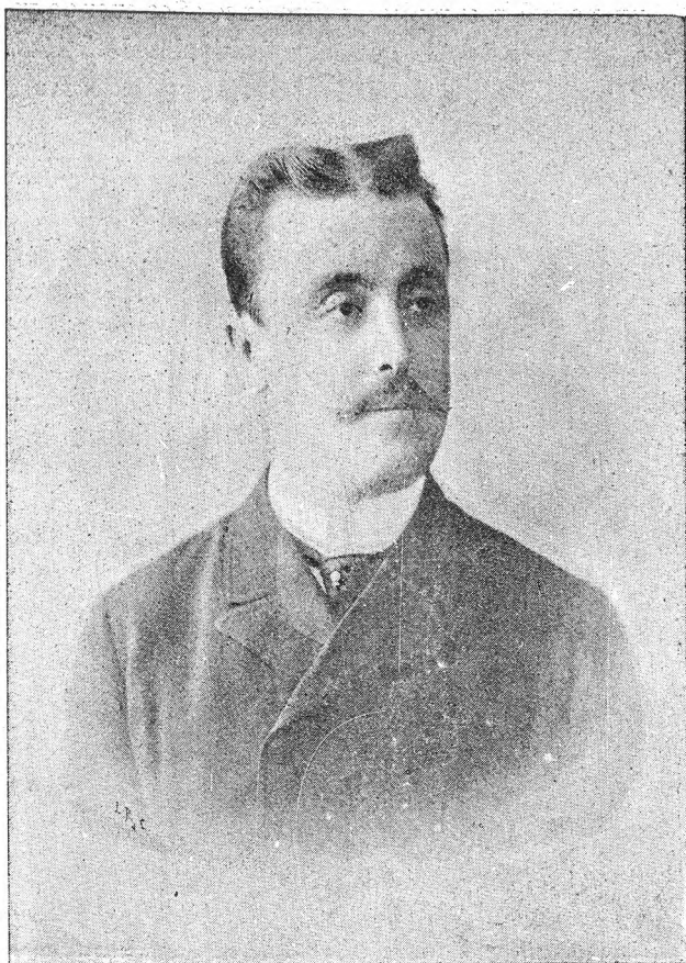
EXCMO. SR. CONDE DE LA CORZANA.

Hombre adornado con los prestigios de su estirpe y con los de su talento, ha de llegar, indudablemente, á ser uno de los más conspícuos personajes políticos de la época.