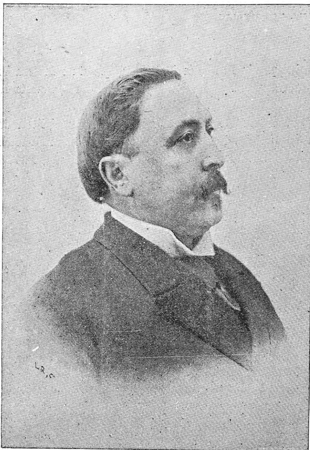
D. EUGENIO CEMBORAIN Y ESPAÑA.

Gran relieve é indiscutible mérito tiene la figura del respetable Presidente de la Diputación Provincial de Madrid, Senador por la provincia de Teruel y docto catedrático de la Escuela Normal Central de Maestros.