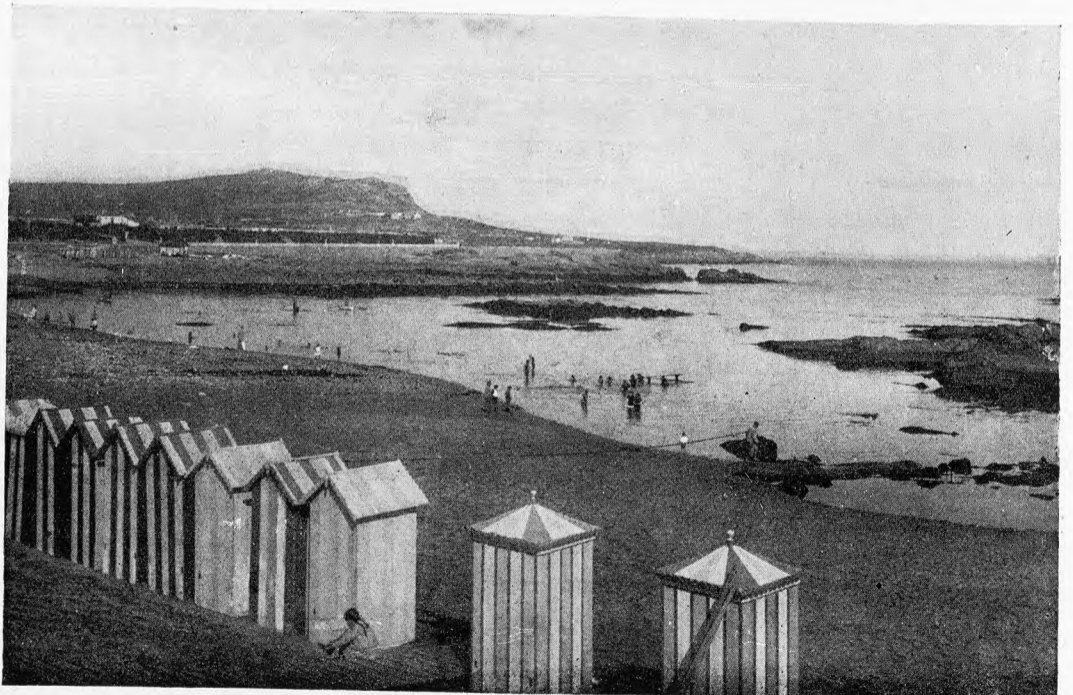
Playa de La Coruña

Sen, Palmeira y Rianjo, todos los cuales, excepto el de Mugar dos, están a cargo de los respectivos municipios.