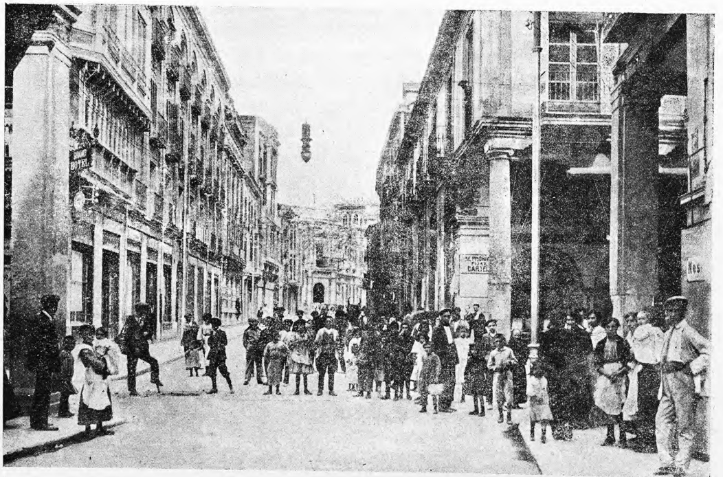
Palencia.—Calle de Don Sancho

La Catedral es notabilísima y tiene 130 metros de longitud por 50 de anchura y 30 de elevación. Comenzó a construirse a principios del siglo XIV y se trabajó en ella hasta el siglo XVII, no hallándose todavía completamente terminada. Presenta varios estilos arquitectónicos, correspondientes a las diversas épocas en que se ha llevado a