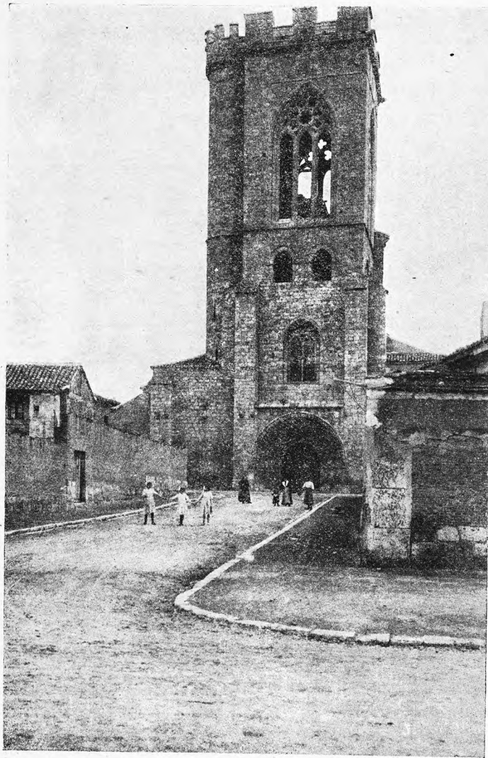
Palencia.—Iglesia de San Miguel

Autilla del Pino. — Villa de 839 habitantes, a 8 kilómetros de Palencia, por carretera, y a 5 de la estación de Villamartín de Campos. Produce cereales, vinos y ganado.