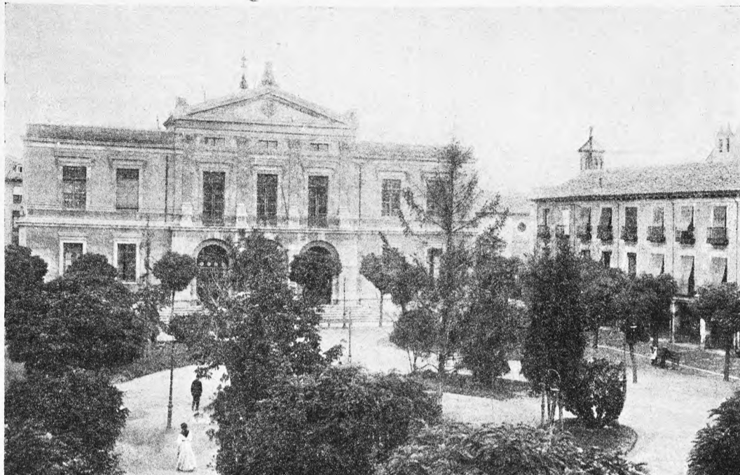
Palencia.—Plaza de la Constitución

rraconense. Resistió largo tiempo el poder de Roma; cercada por Lúculo, en el año 151 antes de J. C., combatió denodadamente, obligando al sitiador a retirarse y hostilizándole hasta el Duero. En 137 antes de J. C. volvió a verse amenazada por un ejército sitiador, mandado por Marco Lépido, pero los palentinos, en una salida intrépida, de-