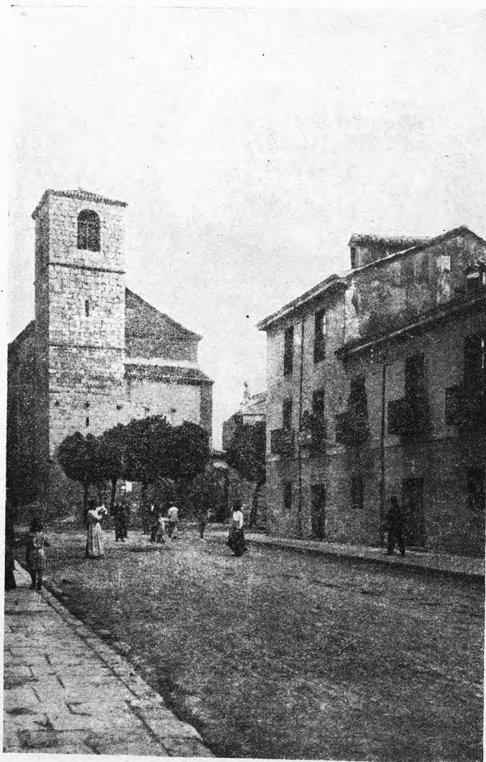
Palencia.—Parroquia de San Lázaro

Grijota. — Villa de 1,182 habitantes, a 6 kilómetros de Palencia, con estación de ferrocarril. Carretera de Palencia a Villada, con un ramal que empalma con la de Palencia a