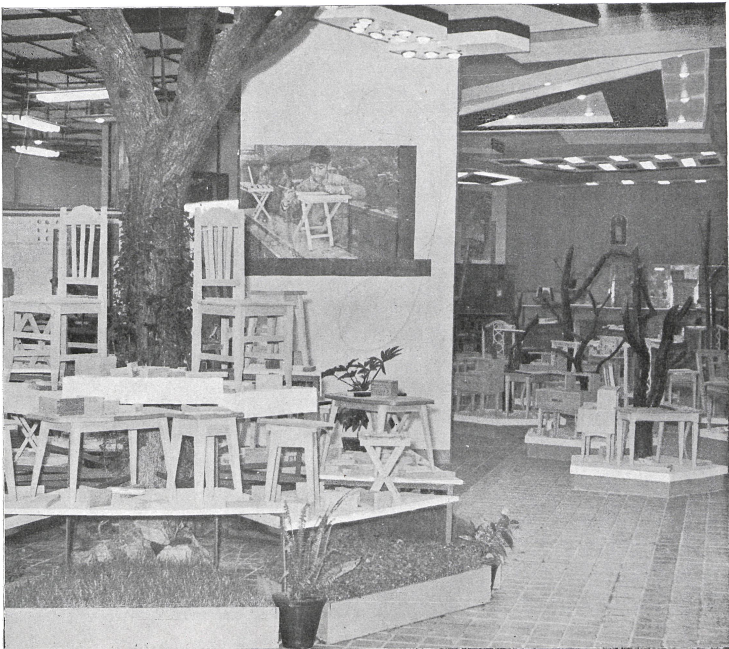
Vista de parte de la nave dedicada a la rama de madera.

sos que en la actualidad disfruta la juventud española sin distinción de clases y medios económicos. Felicitó el señor Alonso Vega a la Diputación y a la Comunidad Salesiana y exhortó a los muchachos acogidos en este Centro modelo para que continuasen perseverando en su tarea de perfeccionamiento con el fin de ser útiles en el día de mañana a la Patria y a la sociedad.