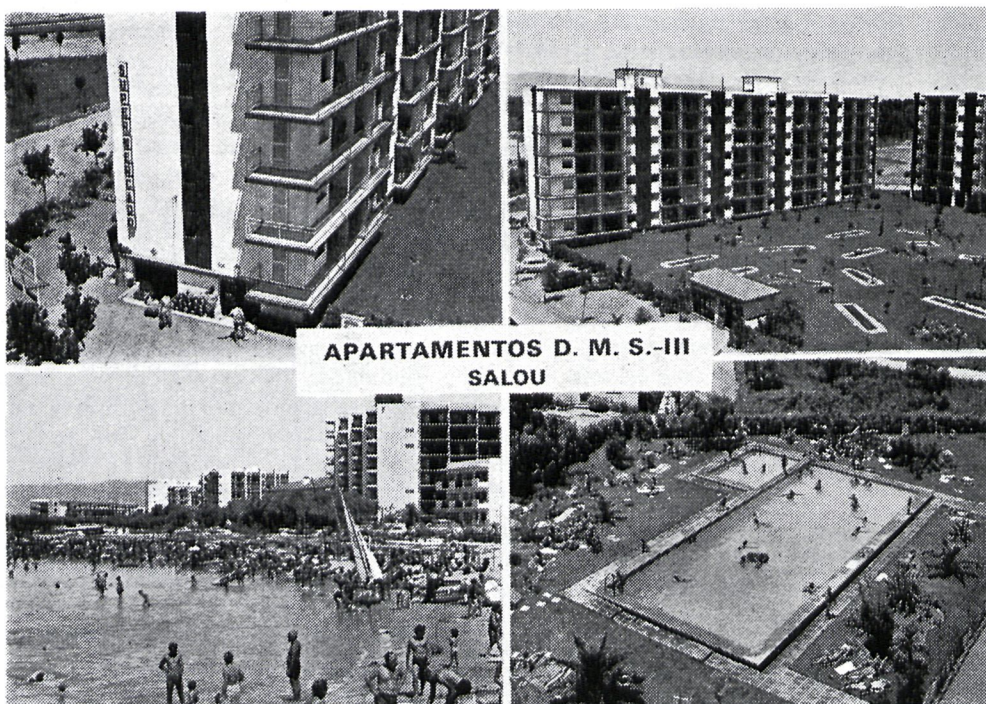
APARTAMENTOS D. M. S.-III SALOU