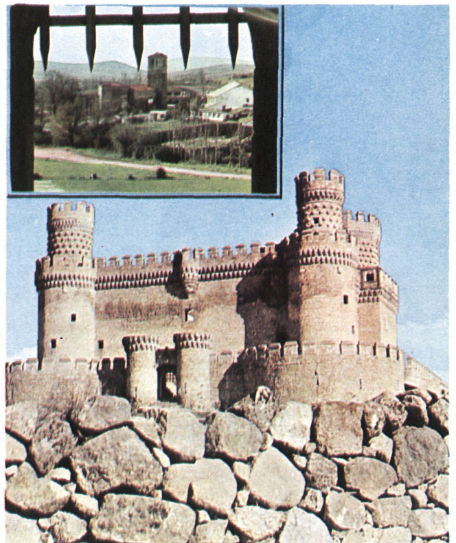
CASTILLO: MUSEO-ARCHIVO PROVINCIAL

Tapas de cocina Especialidad en caracoles Vinos Cervezas y Licores Plaza de Cascorro, 15 Tel. 265 26 19 MADRID.5