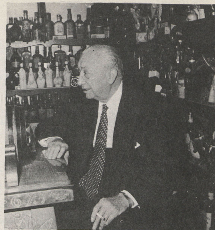
Otra fotografía del ilustre «barman» internacional

Cumplió el servicio militar por espacio de dieciséis meses en Africa (año 1920), en el Batallón de Zapadores del Regimiento de Ingenieros del cuartel de la Montaña. Al regresar a la Península y al inaugurarse el hotel Savoy se incorporó al mismo como barman-jefe . También ocupó este cargo en el Palacio del Hielo y en Pidoux. Chicote trabajaba incansablemente y, por fin, se estableció en el año 1930, abriendo el local todavía existente de la Gran Vía. Además regentó el bar de La Gran Peña y el de las Cortes Españolas. En 1925, el marqués de Comillas le nombró barman honorario de la Compañía Transatlántica. Dos años más tarde hizo su primer viaje largo: Nueva York, donde se celebraron las exposiciones internacionales de Barcelona y Sevilla. Años más tarde también surcó los mares durante seis meses a bordo del navío español «Ciudad de Toledo» como encargado de los tres bares que el barco tenía, recorriendo quince naciones y conociendo personalmente otros tantos jefes de Estado.