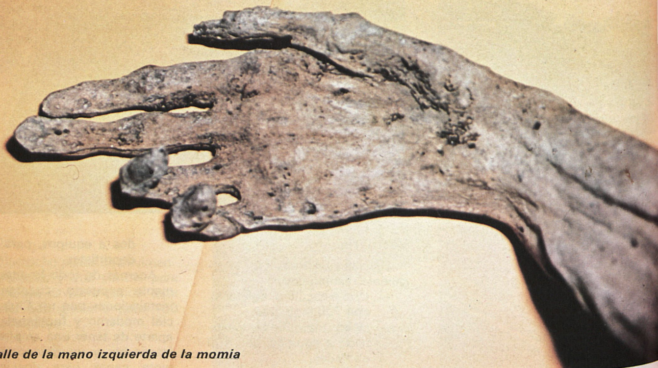
Detalle de la mano izquierda de la momia

E N el número anterior de esta revista hemos hecho una descripción resumida de las líneas de investigación a que han dado lugar «la momia de Colmenar» y la selección, entre el acúmulo de huesos que se exhumaron junto a ella, de los portadores de alteraciones patológicas.