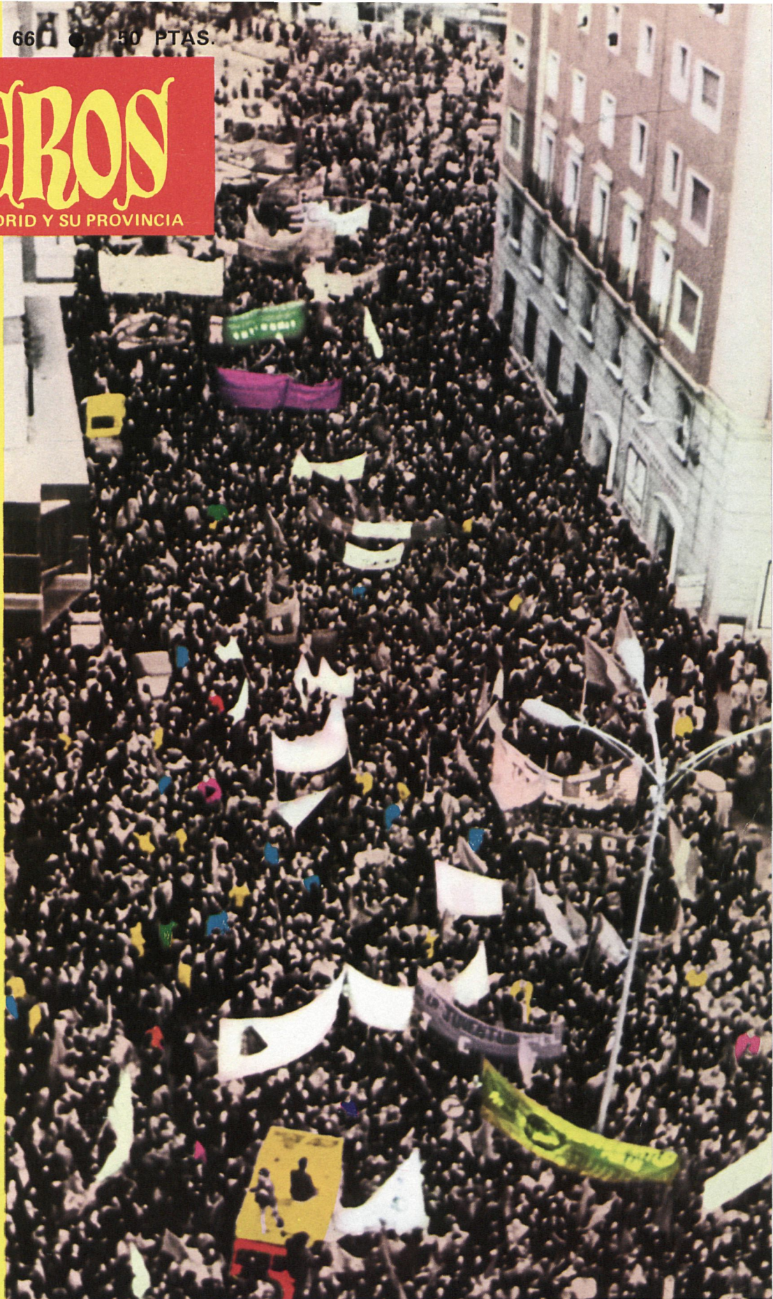
MANIFESTACION PROAUTONOMIA DE CASTILLA Y LEON.—Más de 80.000 personas tomaron parte en las manifestaciones en favor de la autonomía de Castilla y León celebrada en Valladolid, Segovia y Burgos