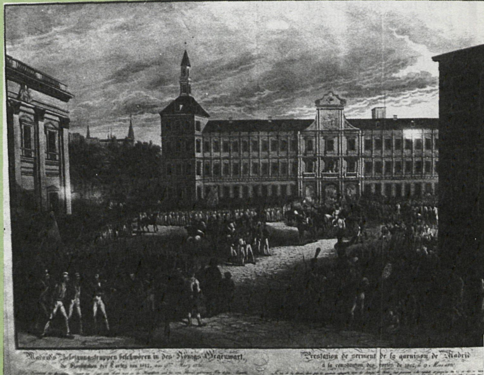
Madrid. Die spanische Truppen beschützen in des Königs Begegnung.