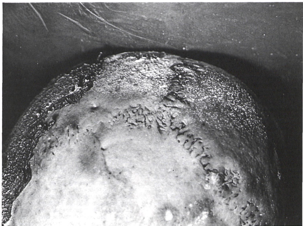
Detalle del cráneo, donde se observan manchas blanquecinas que corresponden a proliferación de colonias de hongos