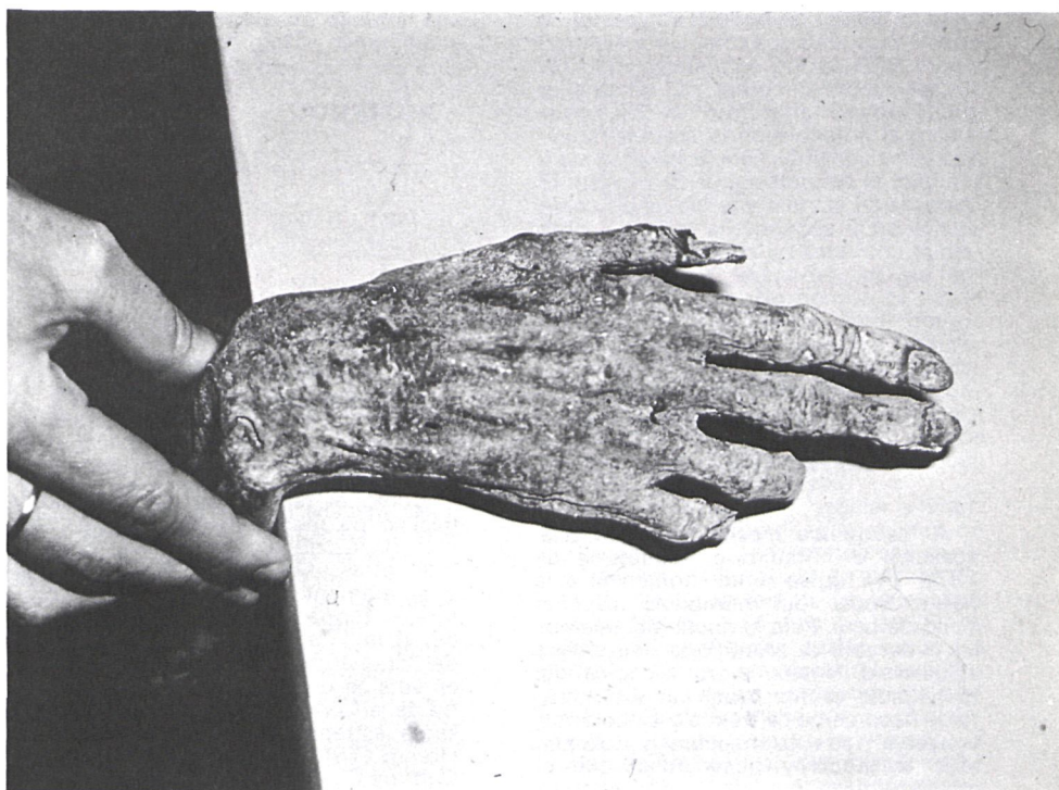
Detalle de la mano izquierda

Las exploraciones médico-forenses permiten descartar una interrupción deliberada del proceso de putrefacción, y señalan como probable causa de muerte una tuberculosis de larga duración, existiendo la posibilidad de una neumoconiosis en el sujeto portador, en función de la abundante presencia de un depósito antracótico pulmonar. En relación con estos hechos cabe resaltar la existencia de una úlcera