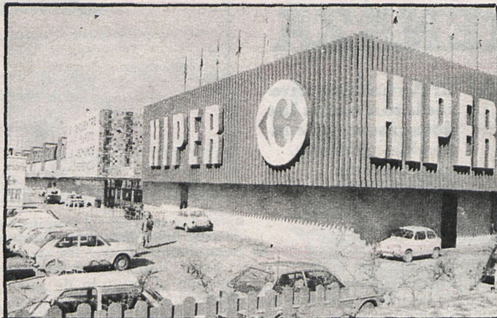
San Fernando no lo quiere

El Ayuntamiento de San Fernando de Henares ha decidido oponerse a la construcción del hipermercado que debía construirse dentro de los límites de este término municipal, según prevé el plan especial de ordenación del gran equipamiento comercial del área de Madrid, realizado en 1974 por los equipos técnicos del Ministerio de Comercio (IRESCO) y del Ministerio de Obras Públicas y Urbanismo (COPLACO).