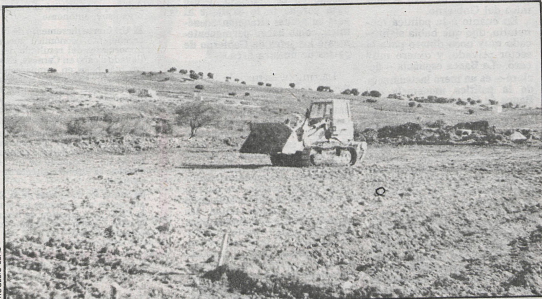
La urbanización tiene aquí su campo de cultivo

Los terrenos urbanizables, monopolizados