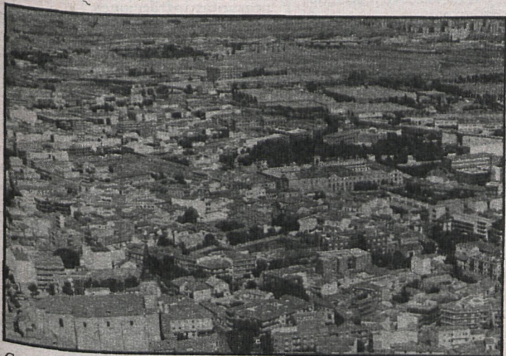
Getafe: Un plan general controvertido