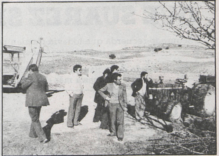
Alcalde y técnicos trabajan sobre el terreno

La actual corporación está tratando de que los terrenos vuelvan a calificarse de acuer-