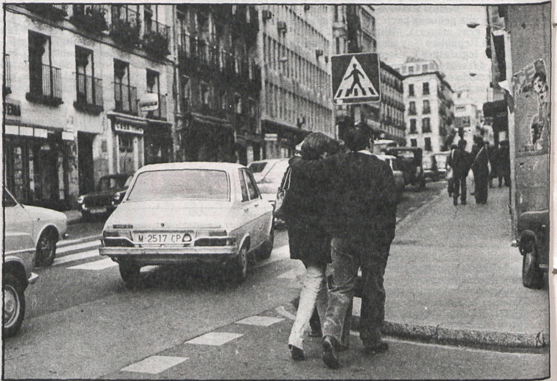
En Madrid se registran la mitad de suicidios que en Barcelona

El número de suicidios por «amor contrariado» y celos desde 1950 a 1975 — últimos datos publicados oficialmente — es tres veces superior que en el período 1905-1950