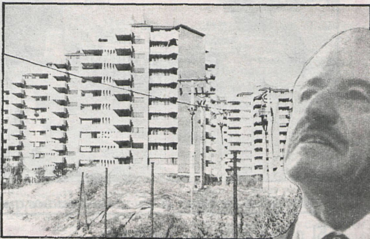
Proyecto de ley de protección oficial a la vivienda