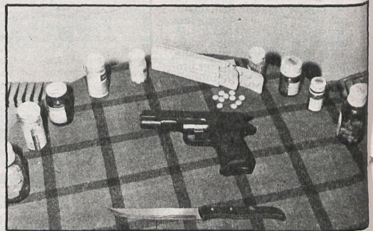
Pastillas —sobre todo barbitúricos— pistolas y cuchillos de cocina son los métodos más usuales

con la vida del romántico Mariano José de Larra, en un piso de la calle Santa Clara, de Madrid, aún hoy muchos jóvenes continúan quitándose la vida por una causa relacionada con un amor frustrado.