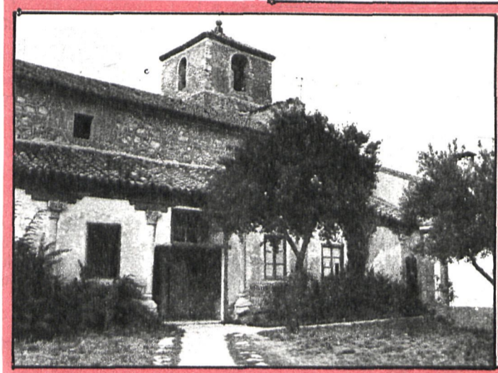
▲ Exterior del bello monumento, una vez restaurado por la Diputación

En su interior, la iglesia presenta tres naves separadas por arquerías de medio punto, sus-