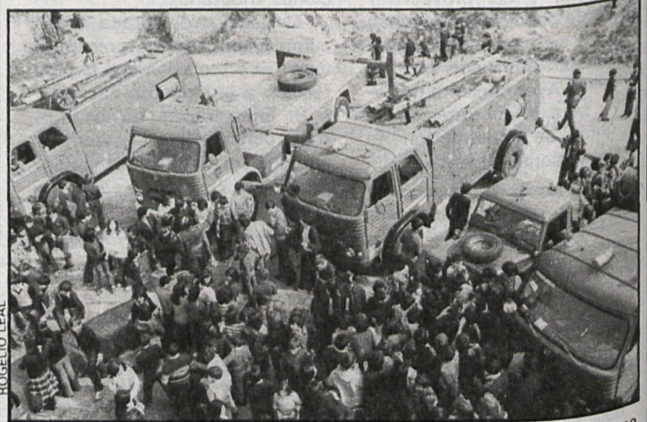
La labor de los bomberos de Alcalá y Arganda es incesante, pero el niño no aparece