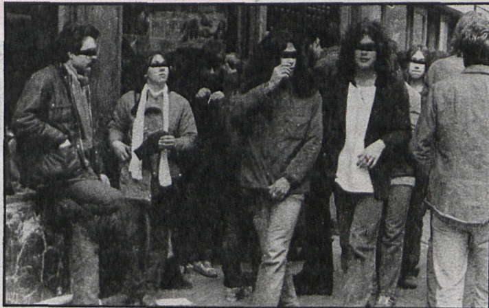
Ya se sabe, al parecer, dónde se va a comprar la droga en Madrid

Y es que en Madrid, un mercado de seis millones de víctimas en potencia, hay estafadores para todos los gustos. Raras veces violentos, encorbatados y enchaquetados, ocultos tras sociedades nunca mejor llamadas anónimas, los «delincuentes de cuello blanco» forman un grupo aparte en el hampa madrileño. Un grupo donde, si son todos los que están, no están todos los que, en rigor, son.