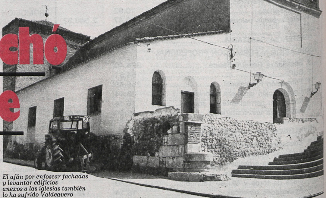
El afán por enfoscar fachadas y levantar edificios anejos a las iglesias también lo ha sufrido Valdeavero

Como bien dice su alcalde, cuenta Valdeavero con un bello conjunto artístico monumental que forman iglesia y palacio, que nos comentaba, perteneció al conde de Floridablanca primero y después al ducado de Medinaceli. Hoy el palacio es propiedad privada, y pretende el Ayuntamiento, con muy buen criterio, limpiar y repoblar los alrededores, quedando así una zona verde ante dicho conjunto.