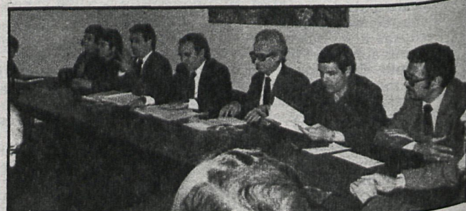
El gobernador civil en la sesión de trabajo celebrada en el Ayuntamiento. Con él, el alcalde y miembros de la Corporación