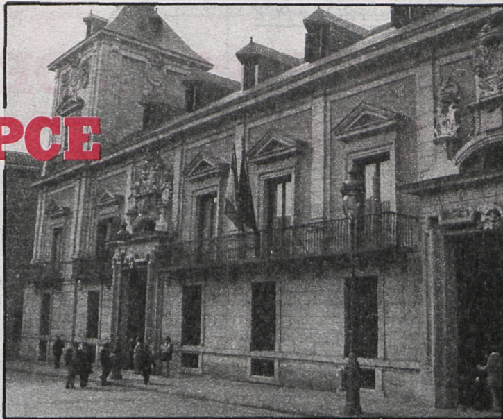
Casa de la Villa: «Luz verde» a la participación vecinal

Para evitar el «amarillismo» o la creación de entidades fantasma, la Junta de cada distrito abrirá un registro con todas las entidades existentes, donde se señale número de socios, actividad fundamental, etc. Sólo las entidades inscritas aquí se podrán acoger a la normativa del decreto de participación.