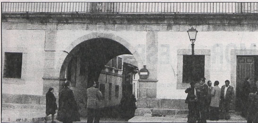
San Martín de Valdeiglesias. Crisis en el grupo de Gobierno