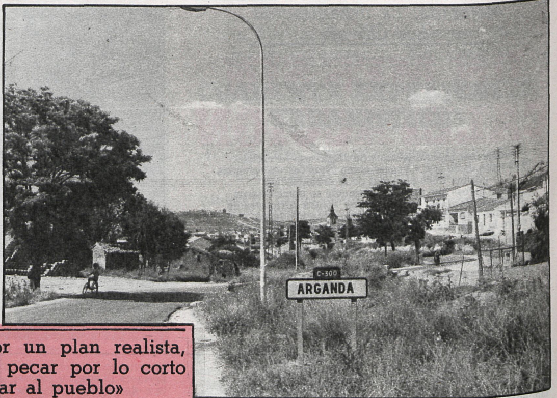
El Ayuntamiento de Arganda lanza su Plan de Acción Vecinal

• Régimen interior. — Personal insuficiente y deficiente organización del trabajo, ampliación de plantilla y reorganización de los servicios, definiendo