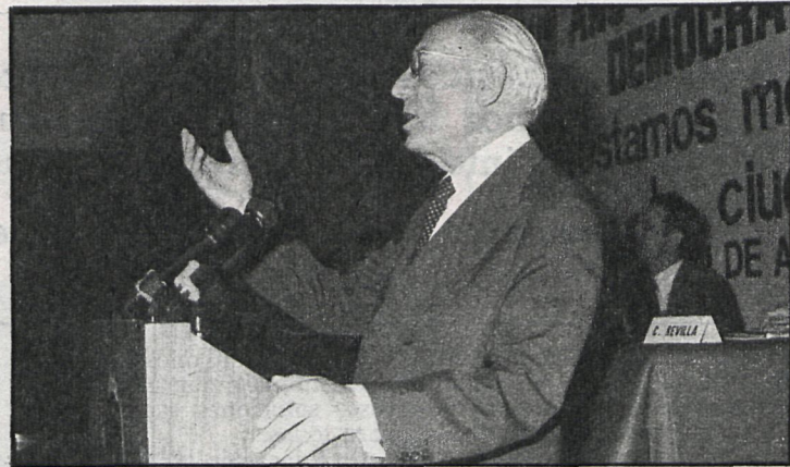
Enrique Tierno Galván, alcalde de Madrid, en un momento de su disertación ante más de ochocientos alcaldes españoles