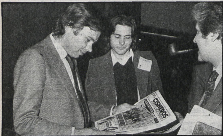
Felipe González, secretario general del PSOE, leyendo atentamente CISNEROS a la entrada del acto

tos, sin que exista la posibilidad del transbordo. Hay que seguir adelante y salvar la democracia, pero de una manera digna: los alcaldes no tenemos que estar en las esquinas pidiendo que el Gobierno nos dé una limosna. Decimos, pues, no a la política de mendicidad. Necesitamos una política municipal clara y decidida; quien viva los intereses comunitarios tiene que admitir que el triunfo de los municipios supone un paso decisivo.»