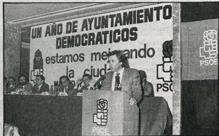
El secretario general del PSOE en el transcurso de la celebración del primer año de ayuntamientos democráticos

mogoneizadora. Por ello, una ley de Régimen Local que dé fuerza a los municipios tiende a equilibrar el Estado y a consolidar la democracia. Para finalizar, dijo que quedaban por delante tres años difíciles por la posición del Gobierno y, en muchos casos, de aquellos que dicen estar con el PSOE y que a la larga hacen un doble juego, dentro y fuera de la Casa Consistorial. «Nuestro partido —dijo— tiene una misión de alternativa de cambio y tiene que asumir como función la construcción de un Estado democrático.»