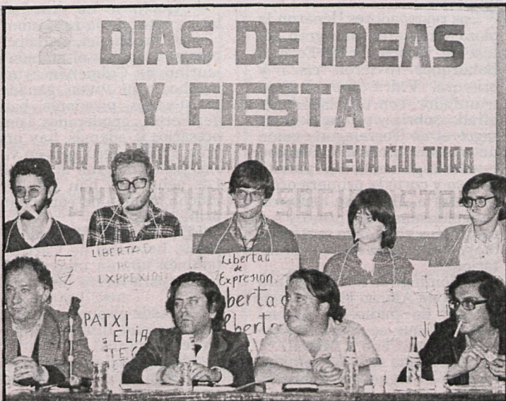
«Dos días de ideas y fiesta». Un momento del debate sobre libertad de expresión, al que asistieron destacados profesionales de los medios de comunicación

Hubo mesas redondas de gran interés durante estos días,