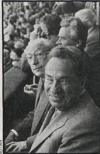
El alcalde madrileño, Enrique Tierno Galván, llevó a la feria isidril a su colega de Moscú. A la derecha de Tierno aparece el embajador ruso en Madrid