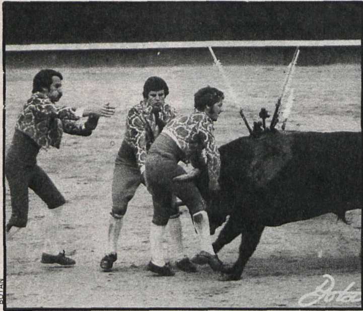
Los «forcados» portugueses