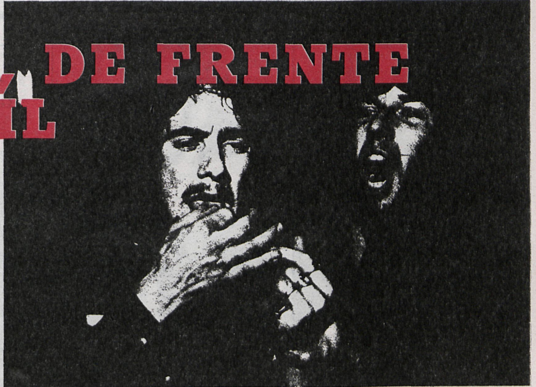
«Kung-Fu» empezó actuando solo y ya actúa con jóvenes mayores que él. Los resultados demuestran que la Administración no se ocupa de los menores difíciles

El nuevo cuarteto con el que «Kung-Fu» opera se mueve con rapidez. Desde su última fuga del reformatorio, a P.A.R. la Policía le acusa —al igual que a sus compañeros— de haber participado en más de treinta robos en establecimientos co-