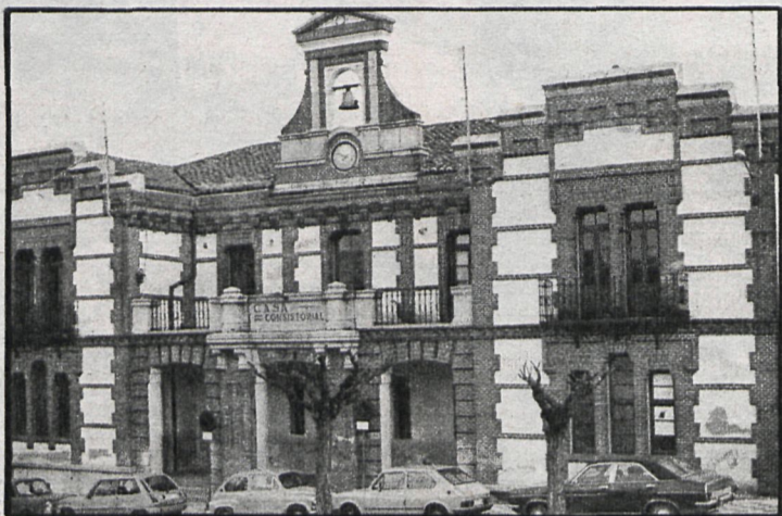
Rascafría vive un grave problema colectivo a causa de la huelga en El Paular

Ante esta situación, el comité de empresa convocó una reunión para consultar si el ir a la huelga sería una buena medida de presión, y efectivamente así lo entendieron los trabajadores, que votaron sí a la huelga por mayoría absoluta. Para llevarla a cabo cumplieron todos los requisitos legales ante la empresa y ante la Delegación de Trabajo, y por fin se decidió que se iría a la huelga los días 9, 10 y 11 de