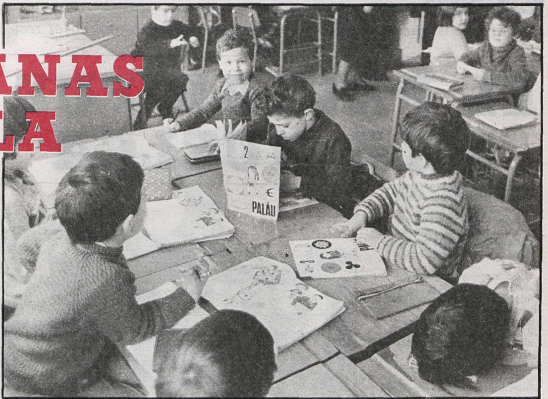
Los escolares de Arroyomolinos, en paro forzoso

Y aunque al principio decíamos que la actividad no ha sido intensa en esta localidad, el Foro Cívico Cultural sigue con un buen ritmo en cuanto a la realización de cualquier tema de los que abarca. Así esta semana ha tenido lugar una charla, cuyo conferenciante ha sido el humorista Forges. La gran asistencia de público confirma el éxito de esta asociación. Próximamente, y en el mismo centro, tendrá lugar otra charla. Su ponente en este caso será otro humorista, que al igual que el anterior se prodiga mucho en los medios informativos. Estamos hablando de Peridis.