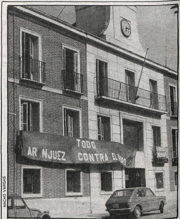
La pancarta denuncia la situación en la misma fachada del Ayuntamiento