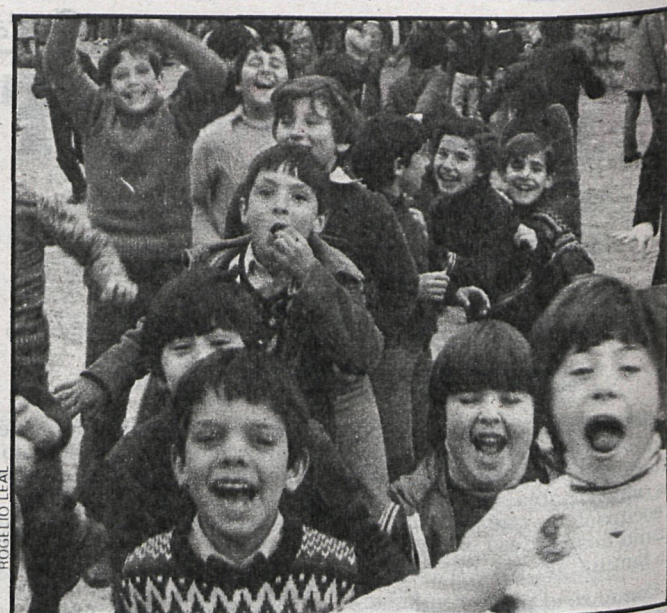
Quince días dedicados a ellos

La noticia más destacada de estos últimos días en San Sebastián de los Reyes está relacionada con el cierre del plazo de inscripción para el próximo curso en todos los colegios. Con el fin de que no se amontonen todos los problemas a última