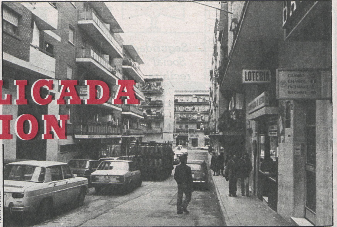
El presupuesto municipal busca reactivar la vida económica de Alcorcón

Este importante avance no se debe a la «generosidad» del