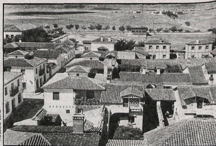
Los vecinos de Brunete tendrán voz en el tema del planeamiento urbanístico

Los resultados de esta reunión podríamos calificarlos de óptimos. La Corporación ha cambiado notablemente, si bien antes solamente se mencionaban criterios, ahora ya se empiezan a mencionar las leyes