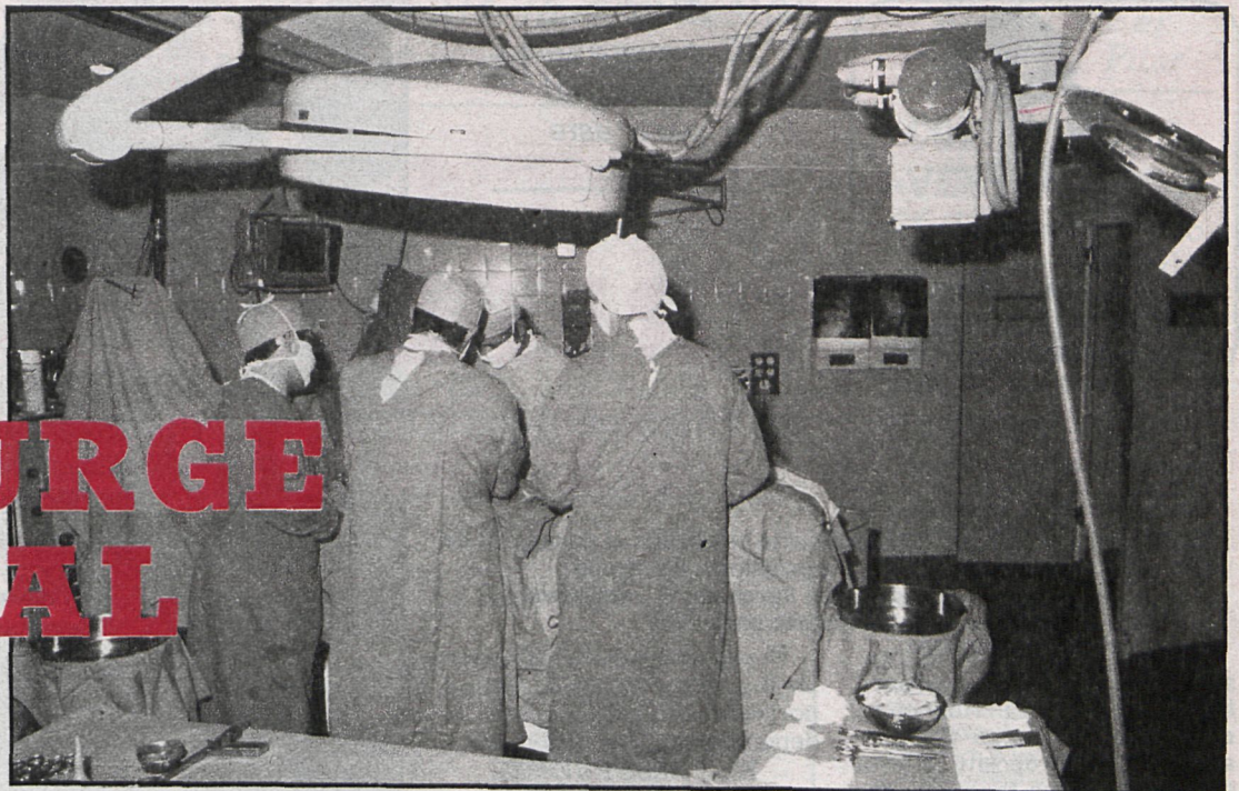
La asistencia sanitaria, una obsesión en Leganés

La Seguridad Social recibirá terrenos para construirlo