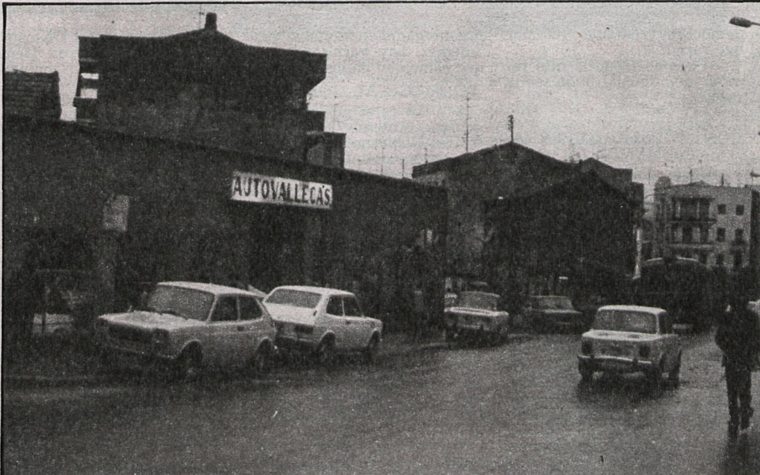
Los barrios de Madrid —Vallecas entre ellos— padecen los efectos y consecuencias del tráfico y consumo de estupefacientes