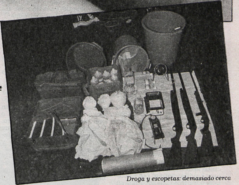
Droga y escopetas: demasiado cerca