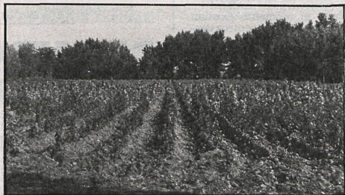
Las producciones de patata y alcachofa, difíciles de sacar al mercado

Las partidas más importantes corresponden a pavimentación de las calles, con más de tres millones de presupuesto, y a las obras de construcciones deportivas y creación del patronato de deportes, con dos millones.