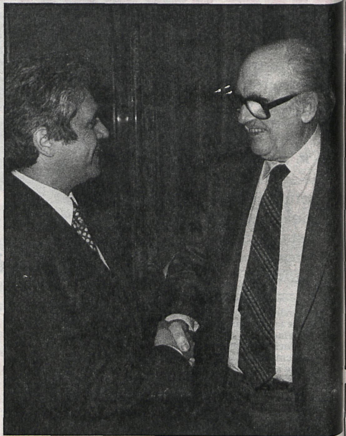
El líder socialista griego Papandreu saluda afectuosamente al presidente de la Diputación de Madrid, profesor Carlos Revilla, en el curso de una recepción con motivo de la visita del dirigente griego a Madrid

Resumidamente las impresiones del jefe de la oposición —que recogió CISNEROS durante su estancia en Madrid— son: El Mercado Común Europeo no es ninguna solución para Grecia, aunque sí para España, de manera que mientras en su país, el PASOK (Partido Socialista Griego) se opone al ingreso prácticamente consumado de su país en la Comunidad Económica Europea, en el contexto general de los países aspirantes al ingreso sí apoya a España. Dice el señor Papandreu que el desarrollo industrial y agrícola de nuestro Estado sí que puede beneficiar a España y a los otros países europeos en un futuro inmediato. Se trata —según Papandreu— de dos modelos de desarrollo distintos y si bien para España —sociedad industrial desarrollada— favorece un ingreso inmediato, para Grecia —sociedad en vías de desarrollo— no serviría sino de regresión y colonización en todos los órdenes.