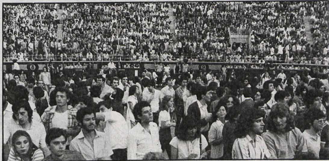
Esta iniciativa de la Diputación Provincial ha gustado a todos los aficionados, que ya esperan el próximo concurso para participar

La actuación de Miguel Ríos fue un estallido de energía y de entrega