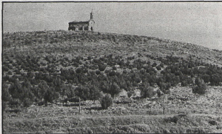
La ermita de San Isidro espera la restauración

tivistas, ya que el Ayuntamiento ha concedido varias licencias, lo que quiere decir que para dentro de uno o dos años es probable que residan en Tres Cantos cuatro o cinco mil personas. En una ciudad que se supone que será modélica, por otro lado parece ser que no se han tenido muy en cuenta las dotaciones; por ejemplo, respecto al tema de las basuras no se tiene previsto nada, y lo mismo ocurre con el cementerio; respecto a la depuradora, se encuentra todavía en la primera fase; en cuanto al tema educativo, aún no ha empezado la construcción de ningún colegio. Ante este retraso en las dotaciones es presumible que las primeras personas que vivan en Tres Cantos carecerán de algunos servicios básicos.