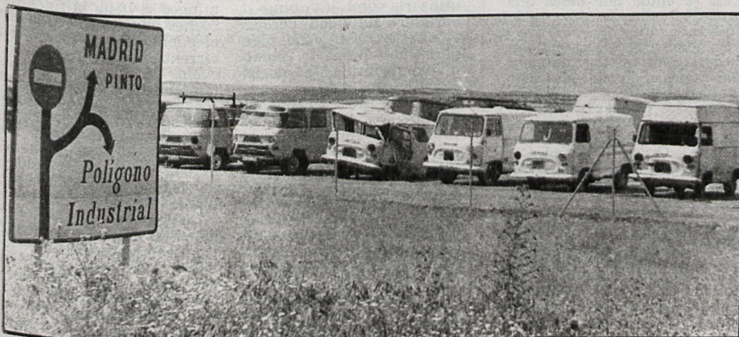
San Martín de la Vega: Todos tendrán que venir aquí

En Getafe hay unos diez depósitos, aproximadamente. El desguace de vehículos desahuciados parece ser un buen negocio, pero causa múltiples problemas allí donde está instalado.