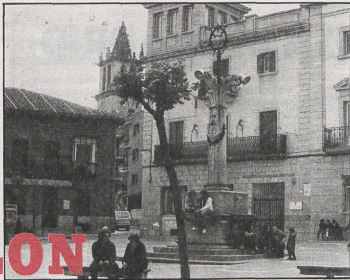
Colmenar: Llegan las sanciones urbanísticas

Cuando comenzaron a hacer los movimientos de tierra los caminos no tenían licencias de obras. Por tanto, y ante tanta irregularidad, la Corporación en pleno aprobó por unanimidad abrir un expediente a la